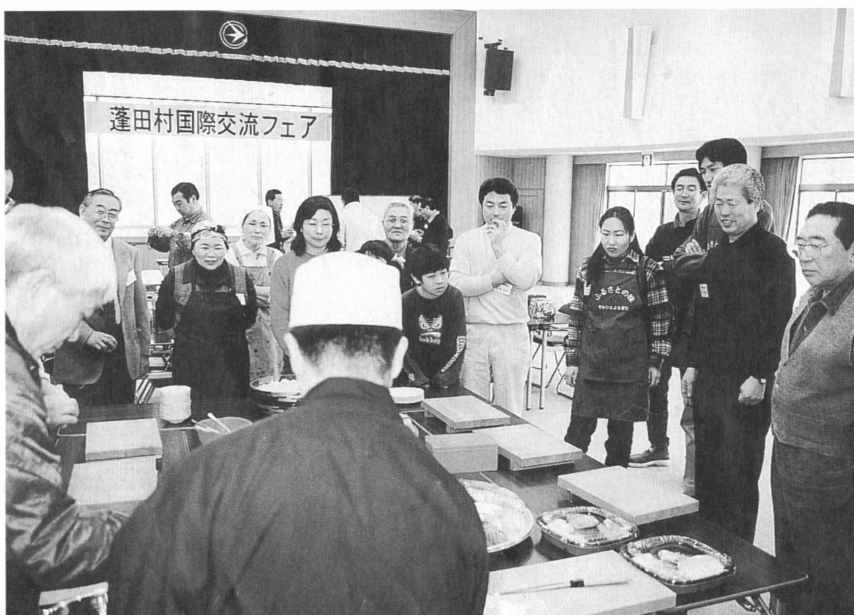
手巻き寿司の手順を教わる会員のみなさん