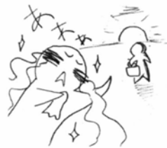
イラスト 八戸有佳李さん

天位 「なみだ」=「青空」 の発想は、大人でも簡単 に出てくるものではありません。 美しいイメージです。