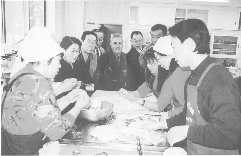
ギョーザづくりに熱心な会員のみなさん