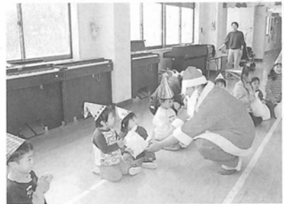
サンタさんにプレゼントをもらってとても喜んでいました