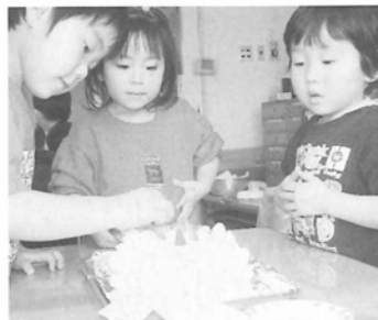
ケーキ作りにとても真剣です