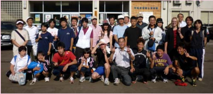
一生懸命走った選手たちと大きな声援を送った応援団