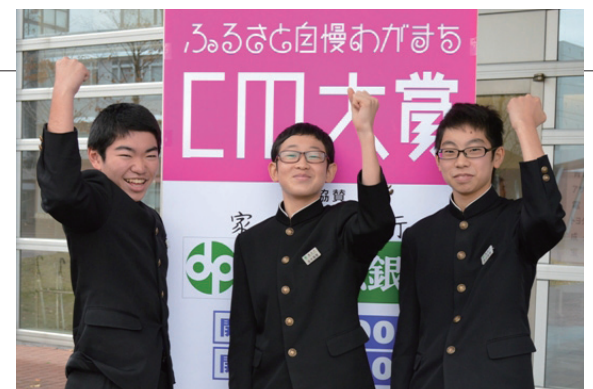
▲「一番見て欲しいのはトマトのシーンです」と3人