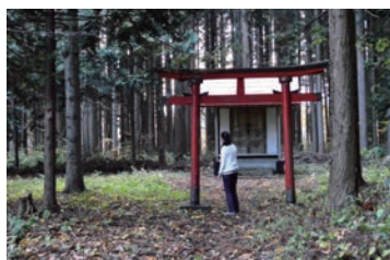
▲森の奥深くの弁天堂址には祠がありました

I enjoyed my visit to Yomogita's castle ruins and shrine. I didn't know there was such an interesting place so close to my house! Although I do not know much about religion in Japan, I enjoy visiting shrines and learning more. Seeing a shrine in the middle of a forest is peaceful. It is also a beautiful place for a walk; I will definitely go back. Mountains, fields, forest, and ocean: Yomogita has it all.