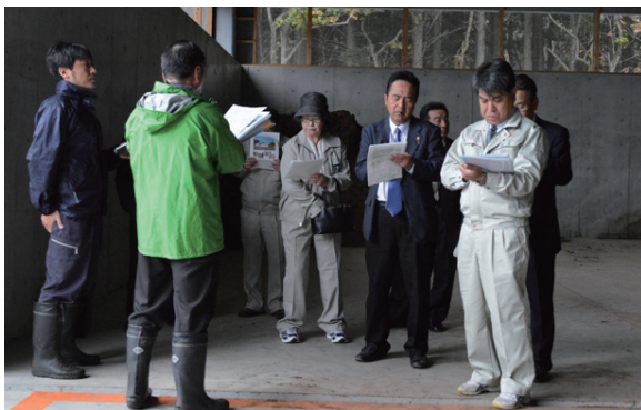
▲他町村からの視察団も多数訪れている

ホタテ養殖残渣堆肥化処理施設は、北海道のばんけいリサイクルセンター社の処理システムを県内では初めて採用。また海産物の堆肥化は、県内自治体では初めての試みとなります。視察に訪れていた平内町の担当者は「これまでの焼却では多大な経費がかかる。資源として再生できれば農業のお互いに良いこと」と話していました。循環型の処理方法の構築に向けた取り組みは、県漁連や陸奥湾沿岸の他自治体も注目しています。