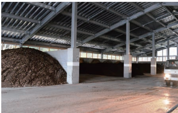
▲発酵処理で残渣特有の匂いも消える

村の経済で重要なウエイトを占めるホタテ漁。これまで大きな課題となっていた養殖残渣を、地域内で有効活用しようと建設した「蓬田村ホタテガイ養殖残渣堆肥化処理施設」で製造された堆肥の無償配布が行われました。今年のホタテガイ生産量5千トンに対し発生した約700トンの残渣と、鶏糞、もみ殻などを混合したものを3〜4ヶ月かけて発酵処理。10月に約200トン、11月に約100トンの堆肥が出来上がり、農家に無償配布されました。