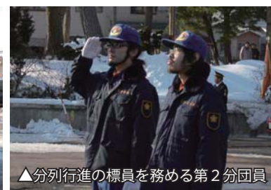
▲分列行進の標員を務める第 2 分団員