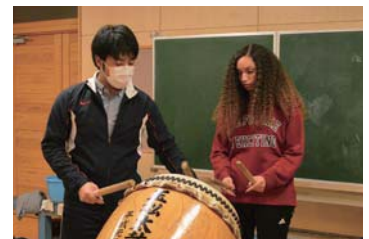
▲バチを持つのは初めてでした

I have always thought that taiko was really nice to listen to and even went to a taiko concert when I studied abroad in Nagoya. So, I was really excited to participate in Tamamatsu Taiko's practice. I was only there for 30 minutes and I only learned a small portion of an entire song, but the experience was really exciting. The group members were all very nice and were patient with me as I learned how to play. It was also very exhilarating to feel the air around me vibrate with the drums sound as the group practiced for an upcoming performance. I would definitely like to try playing taiko again soon, and maybe I'll participate in Tamamatsu Taiko's practice when it picks back up again in the summer.