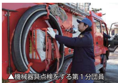
▲機械器具点検をする第 1 分団員