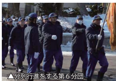
▲分列行進をする第 6 分団

吉田団長は「点検、行進においては力強さを感じた。今年 1 年無火災を目指して活動していただきたい」と訓示しました。久慈村長は「団員の力がなければ多様化する災害に対応できない。引き続き地域の安全確保に向けた活動をお願いしたい」と挨拶を述べました。