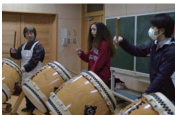
▲みんなで合わせて演奏できました

(意訳：私はいつも太鼓を聞くのはとても楽しいと思っていて、名古屋に留学した時は太鼓のコンサートに行きました。そのため、玉松太鼓の練習に参加するのが楽しみでした。わずか30分で曲の一部を教えてもらったのですが、とても楽しい経験でした。会員は皆親切で、私が教わっている間、辛抱強く待っていてくれました。イベントに向けての練習を聞くと、太鼓の音で私の周りの空気が振動するのが感じられ、とても爽快でした。また絶対に太鼓の演奏をしてみたいと思うので、夏に練習が始まったら参加したいです。)