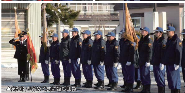
▲気を引き締めて式に臨む団員