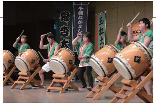
▲強弱をつけた激しい演奏で観客を魅了しました

音楽や伝統を楽しむイベント「第4回あおもりじゃわめぐ音の会」が青森市のアウガで開催され、玉松太鼓保存会が参加しました。青森市内外の団体が和太鼓や手踊り、スコップ三味線を披露する中、同会はリズムの掛け合いが見所の「大館（おおだて）」を披露し、迫力のあるパフォーマンスで会場を包みました。