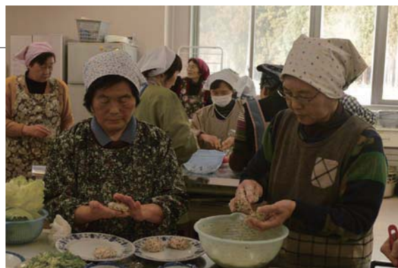
▲豆腐と鶏ひき肉同量を混ぜたつくねはふっくら

生活習慣病予防を目的とした料理教室がふるさと総合センターで開催されました。参加者約 20 名は、村食生活改善推進員の指導のもと、「しらすと枝豆の炊き込みごはん」や「ひじきと野菜のつくね卵あんかけ」などを作りました。だしを活用した、おいしい減塩メニューを試食した参加者は、食生活の改善が健康への第一歩だと学びました。