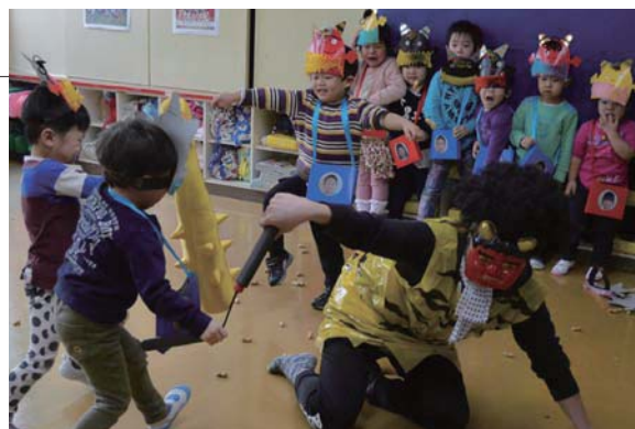
▲力を合わせて鬼を追い出します

蓬田保育園で節分の豆まきが行われました。手作りのお面をつけた園児たちは「鬼は外、福は内」とかけ声の練習をしましたが、太鼓の音とともに鬼が現れると怖くて泣いてしまう子や先生にしがみつく子など様々な姿が見られました。最後には、手作り箱にいっぱいのお豆をまいて鬼退治をし、みんなで仲良く豆を食べました。