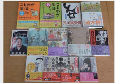
▲小説・エッセイ・暮らしの本など幅広く取り揃えています