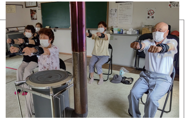
▲映像に合わせて30分ほどゆっくりと体を動かしました

長科地区公民館で介護予防体操「いきいき100歳体操」の第1回目が行われ、11名が参加しました。この体操は、高知県で生まれた介護予防体操で、集まって体操をすることで継続しやすくなるほか、交流の場としても期待ができます。近所の仲間同士などでいきいき100歳体操に興味のある方は、役場健康福祉課までご連絡ください。