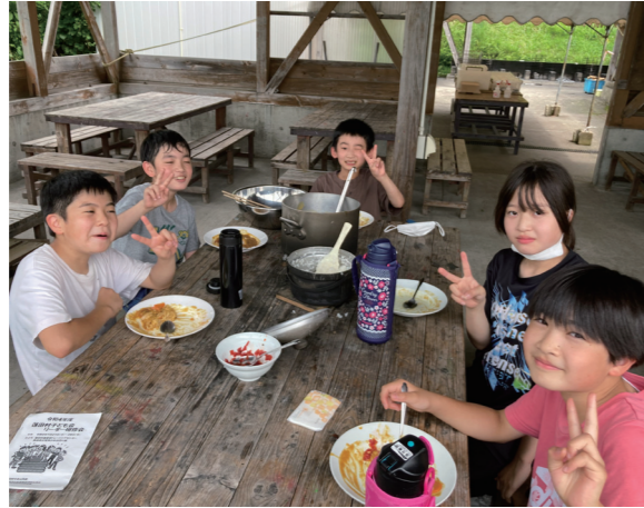
▲かまどで作るカレーライスは格別です