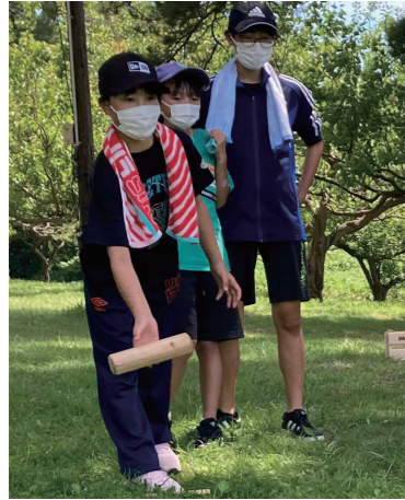
▲ニュースポーツ「モルック」を体験