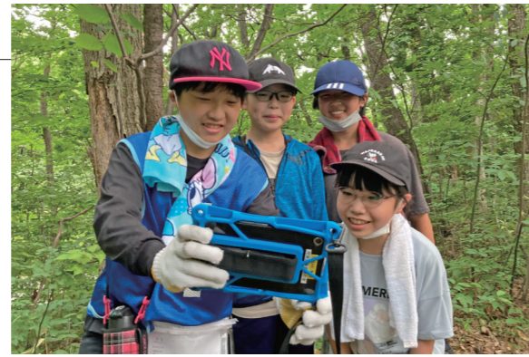
▲QRゲームはグループで協力しながら進めました

7月27日と28日、五所川原市の梵珠少年自然の家で子ども会リーダー研修会が行われました。27日は、17名の児童がカレーライス作りや、敷地内にあるQRコードを読み取って指令をクリアするQRゲームを行いました。28日は、12名の児童が火起こし体験やモルックというスポーツを楽しみ、集団生活の中で交流を深めました。