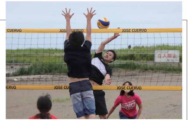
▲ダイナミックなプレーは迫力満点

玉松海水浴場で3年ぶりにビーチバレーボール大会が開催され、村内外から8チームが参加しました。小雨が降る中での競技開始となりましたが、選手たちは予選リーグから白熱した試合を繰り広げました。見ごたえのあるラリーや、1点1点を取り合う接戦に、会場は大いに盛り上がりました。