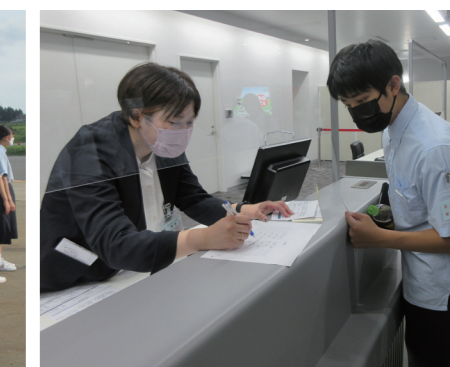
▲一人ずつチェックインの手続きを体験