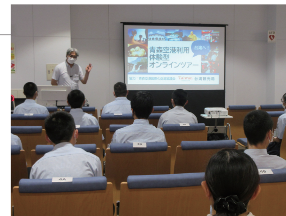
▲オンラインツアーを通して台湾への関心を深めました

蓬田中学校3年生を対象としたオンラインによる海外研修事業が、青森空港で行われました。参加した15名の生徒は、空港での各種手続きの体験やオンラインツアー、国際線ターミナルの見学などをしました。オンラインツアーでは、台湾の人口や観光地、食べ物などを映像を見ながら学びました。また、台湾で日本語を学んでいた元学生とオンラインで質疑応答する機会もあり、生徒たちは歴史建造物やスポーツなどの話をして交流を深めました。