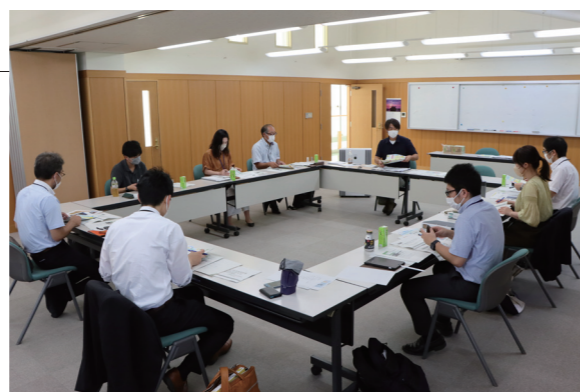
▲熱心に意見交換をする参加者の皆さん

東通村の職員らが蓬田村を訪れ、誰もが安心して暮らせる社会を目指す、地域共生社会の取組を視察しました。蓬田村社会福祉協議会は、助け合い交通と援農ボランティアについて、蓬田村役場はコミュニティバスや集いの場づくりについて説明したほか、東通村の現状も紹介され、地域の課題解決に向けた意見交換が行われました。