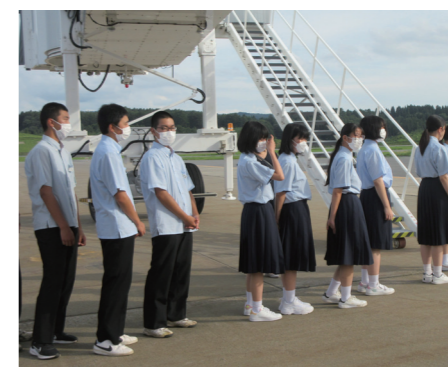
▲国際線ターミナルの制限区域内を見学