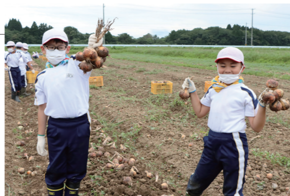
▲形や大きさ、匂いを確かめながら収穫しました

なお、玉ねぎ生産組合は、8月と9月に学校給食で使用する玉ねぎを、給食センターへ無償提供しました。