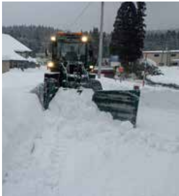
今年1月正月明け、夜通しの除雪作業後 村内数カ所を排雪

特に積雪の多かった今冬の除排雪作業を通して、議員と除排雪担当課、除雪隊員との意見交換を行い、来シーズンからの除排雪のあり方について検討しました。