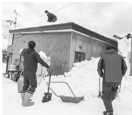
依頼を受け、役場職員が手分けして除雪を行った