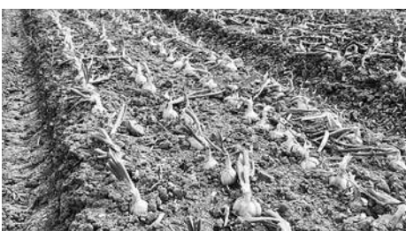
収穫前のタマネギ

実際、農協の今あるハウスの隣を予定はしているが、まだ具体的な交渉等はしておらず、これからになる。