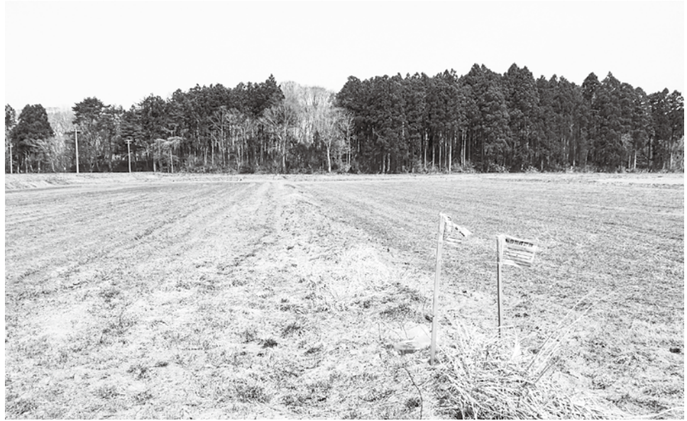
郷沢地区の畦畔が崩れた転作田。ソバを作付けしている

ものの種類が、戦略作物の上がりに対する交付金と水田を利用するための交付金と別なので、そこは切り分けて考えないといけない。