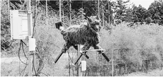
昨年度導入のモンスターウルフ。今年度は3基増やす予定

やったらもうその地区にはカラスが現れなくなった。それで、猿にも同じような効果が得られるのではないかとのことだった。タブレットを使い、ボス猿を確認したら、そこへドローンを持っていき、その場所を認識させると2キロまで自動追尾するという形だそうだ。1週間とかやると猿の集団がいなくなるだろうというところで、モンスターウルフの導入もいいが、新しい技術を取り入れたものも検証してはどうか。