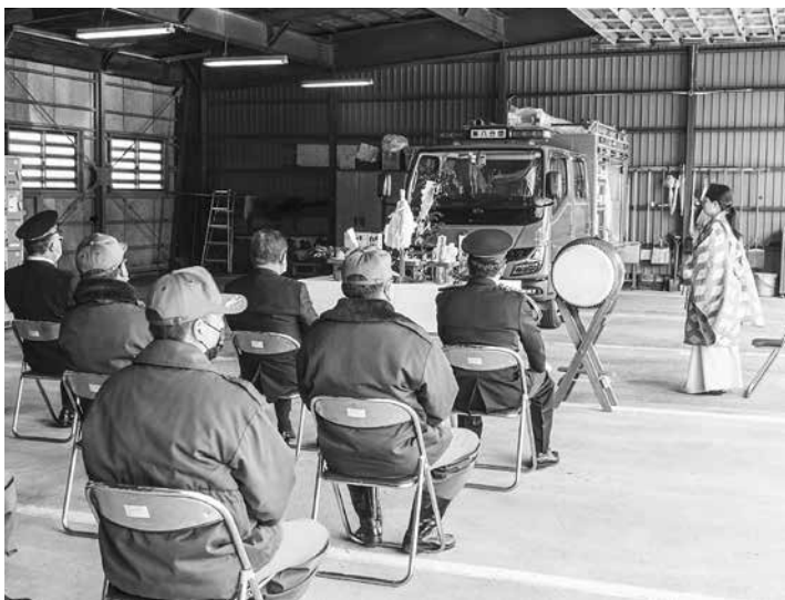
4/27 令和3年度で導入した第8分団小型ポンプ車付積載車入魂式