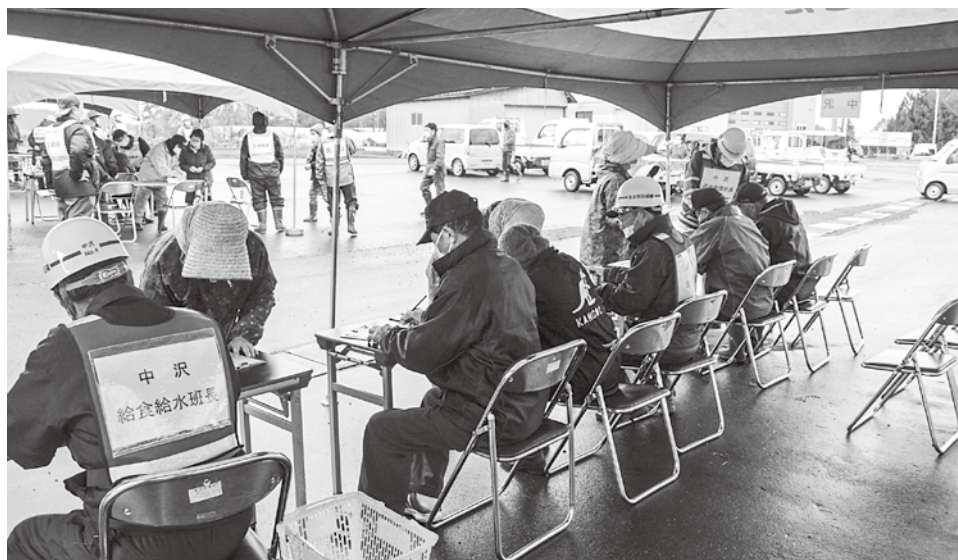
中沢、長科、阿弥陀川地区の住民が今回避難したライスセンター前の敷地。訓練に参加した住民は、名前、移動手段、移動時間ほか、アンケートの記入をした。