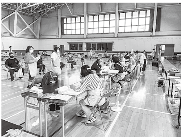
令和3年度住民健診