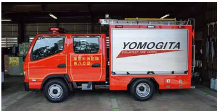
待ちに待った新しいポンプ付積載車