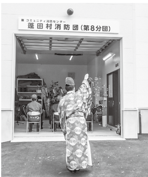
5/1 第8分団屯所竣工式(高根地区)

A (総務課長) できるだけ早く発注をかける、契約も早くしたいと考えている。しかし、今の時点で業界に影響が出ているのであれば、仮に早く発注をかけても納期は遅くなる可能性があるのをご理解いただきたい。