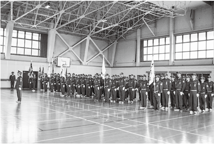
令和元年度蓬田村観閲式。以降、新型コロナウイルス感染拡大防止に伴い開催はできていない

全条例案が賛成多数で可決しました。主な条例改正をご紹介します。 (全議案の審議結果は次ページをご覧ください。)