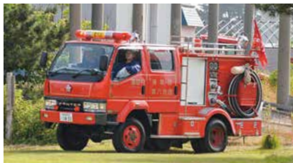
これまでのポンプ付積載車