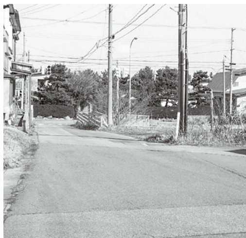
国道280号線から蓬田中学校踏切までの工事区間