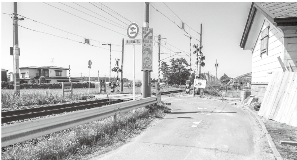
JR蓬田駅を出て左手に進むと見えてくる寺道踏切 渡って100mほどまっすぐ行くと新庁舎建設予定地がある