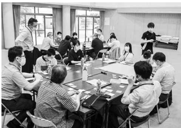
令和7年開庁向け準備は着々と進んでいる 7月に行われたワークショップ 村内の中学生や高校生 大人がこれからの蓬田村役場について意見を出し合った