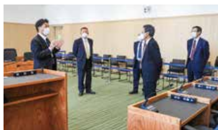
議場内の傍聴席からは議員の顔も理事者（各課長）の顔もよく見える