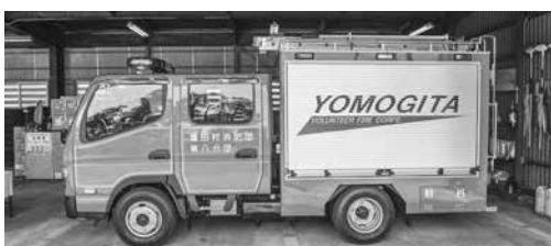
昨年度配備された第8分団のポンプ付積載車 同型のものが第6分団にも配備される

小型動力ポンプ付積載車 (蓬田村消防団第6分団) 購入について、指名競争入 札を行い、契約金額、14 69万6000円で有限会 社丸栄消費との契約締結を 可決した。