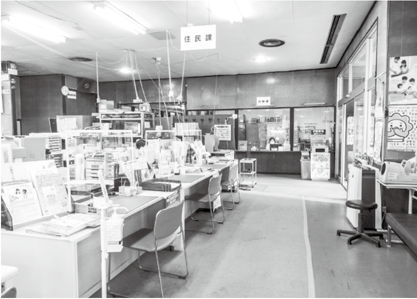
新型コロナウイルス感染症に関連した給付金や補助金の制度は多岐にわたる