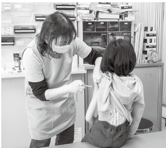
11歳以下の接種も行われている

割合で言うと、18歳以上の3回目接種した人の約21%がモデルナ社のワクチンを打っている。