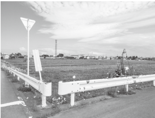
役場新庁舎建設予定地（バイパス側から撮影）

Q 建設用地は、バイパスの東側に決定している。北海道沖の大地震による津波被害が及ぶことが発表されています津波の高さが最大で4メートルとされている。これでは新 A 庁舎も浸水の恐れがあると思う。 用地の土盛りをバイパスと同じ高さにしなないと被害を受けるとなると思うが、土盛りの高さはどのくらいにするのか。