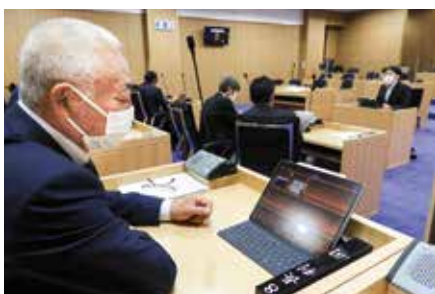
タブレット端末を実際に操作してみる