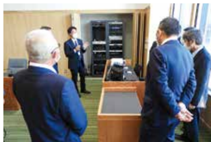
本会議は庁舎内に中継されている

議場は、災害時はもちろん、多目的に使えることを考慮して、フラットな仕様になっていました。また、議員の机などもコンパクトで使い勝手のいいものを選んだとのことでした。