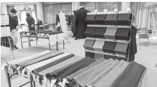
ふるさと納税でも好評のオーダースーツ