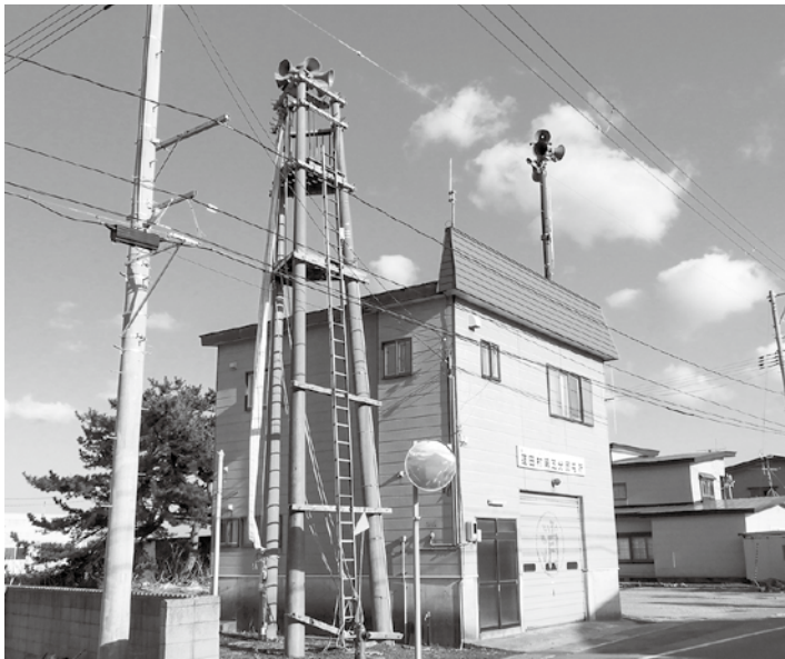
令和6年度建替え予定の第5分団屯所