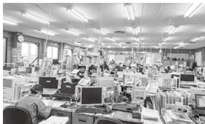
LGWAN (総合行政ネットワーク) 端末は75台に