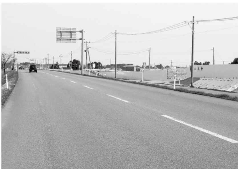
新庁舎向かい側は子供のいる世帯が村内で一番多い地区