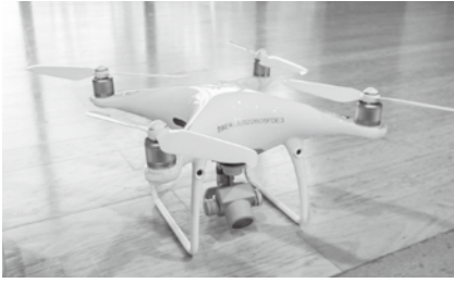
昨年10月の体験会で紹介されたドローン