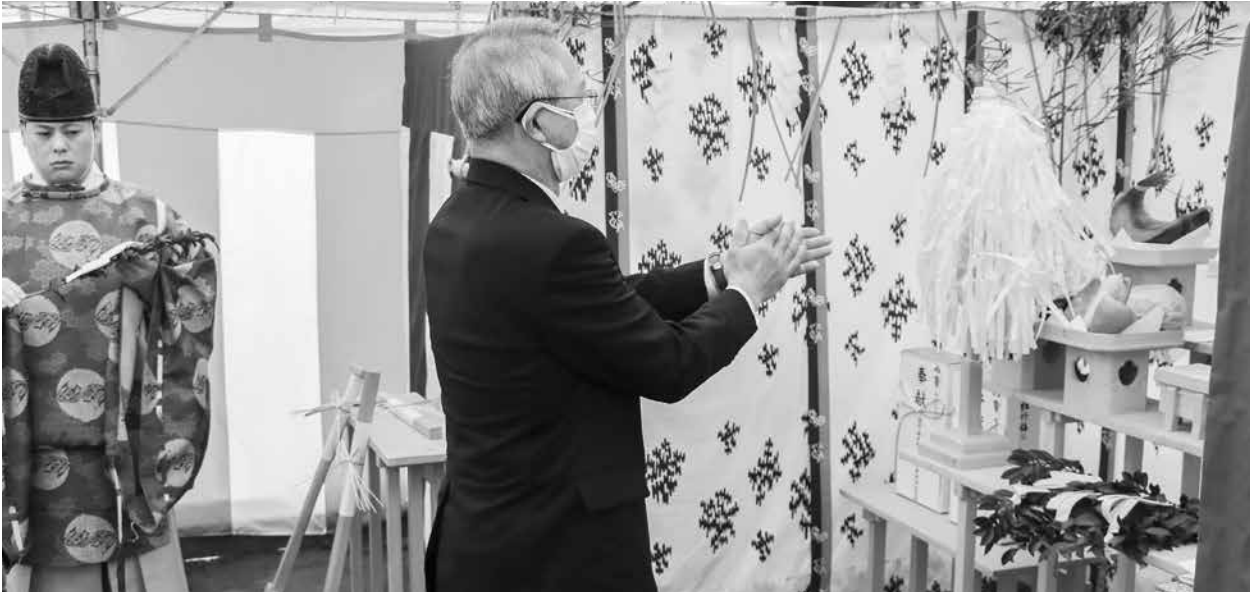
3/13 新庁舎建設工事安全祈願祭