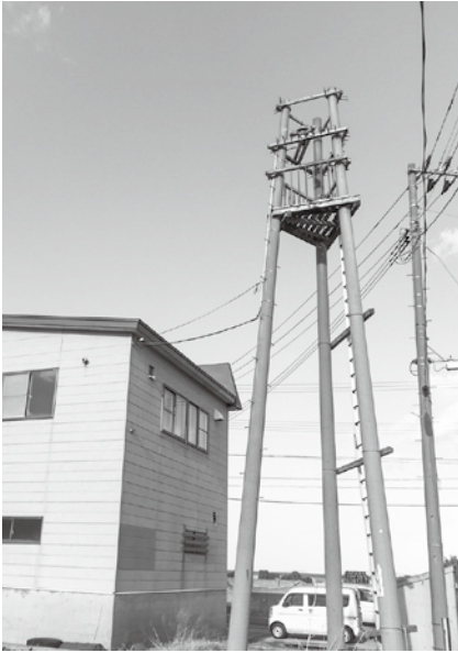
腐食のためサイレンが鳴らない