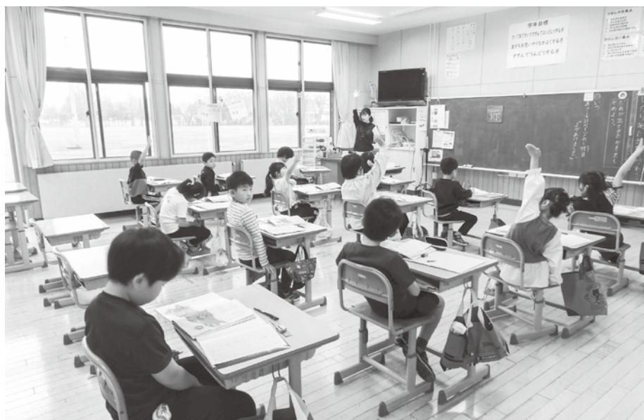
教室、特別教室、職員室等に設置予定