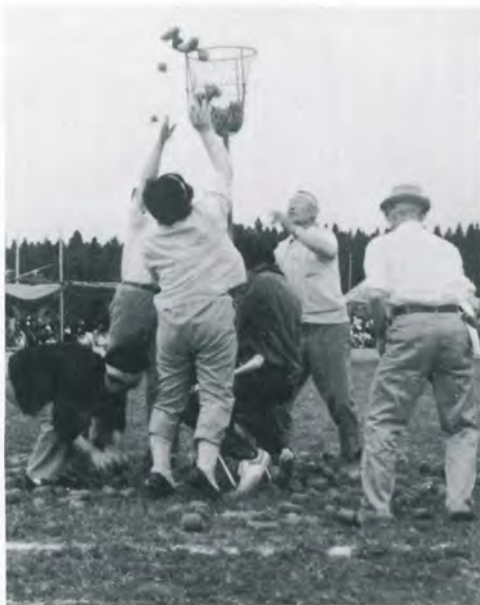
▲ながなが入らぬじゃ