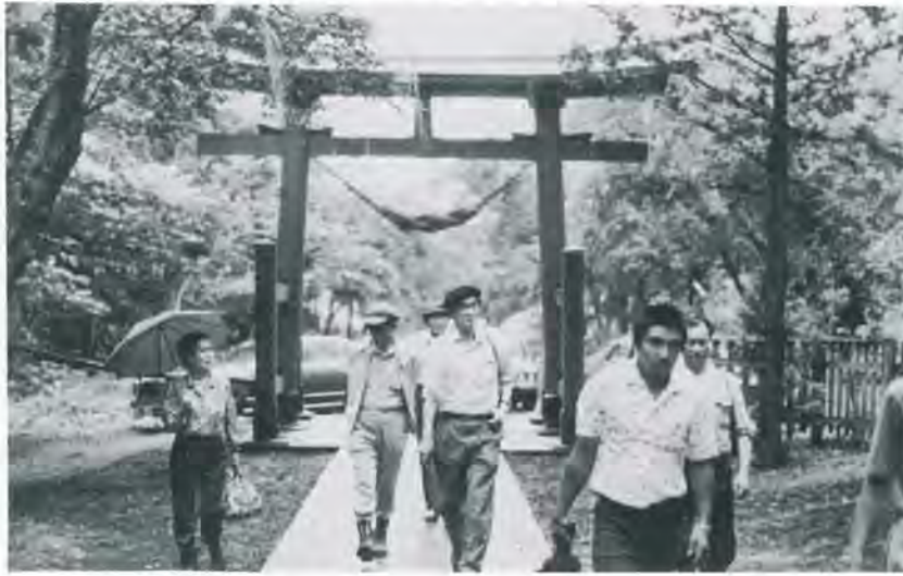
(ベレー帽をかぶっているのが 東京大学名誉教授三上次男博士)