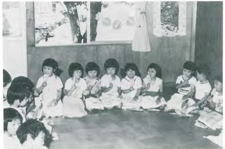
(きょうのおやつはアイスクャンデー)

広報編集委員会から 都合により、七月号は休ませてくださいました。 尚係では、みなさんからの 広報へのお便りやご要望を、 お待ちしております。