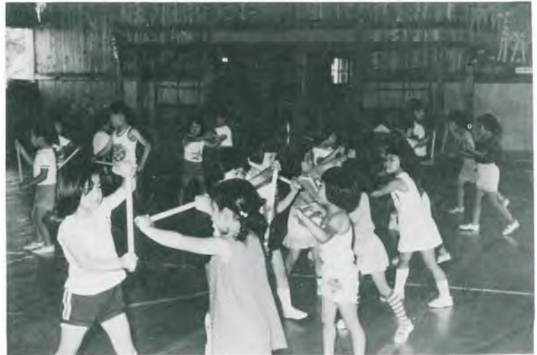
(れっきとしたお遊戯です)