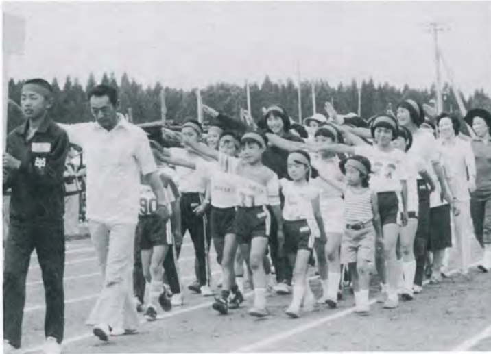
▲堂々と入場・この笑顔