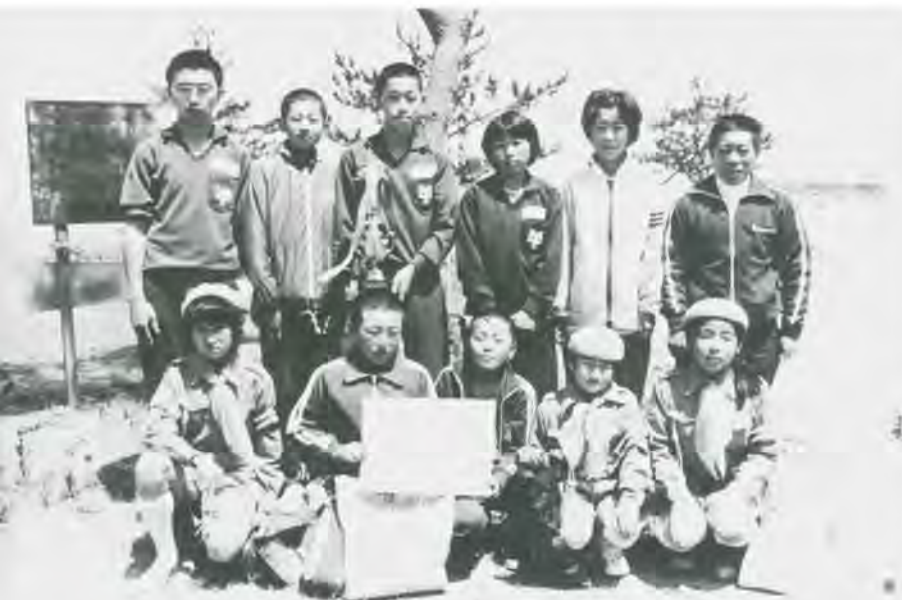
高根道路での練習の成果です。駅伝大会みごと3位。

◎今回で、子ども会通信は終了します。子ども会のみなさん、世話人のみなさん、楽しいお便りありがとうございませう。