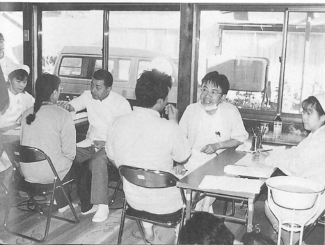
昨年度の歯科検診のようす

検診の申し込みは各地区の保健協力員が皆さんの家庭を巡回しますので、8月2日までに申し込んでください。又、村の検診の対象者が実際のどの位いるのか事前に把握したいと思いますので、調査用紙が届きましたら、ご家族の受診状況について、ご面倒でも記入し