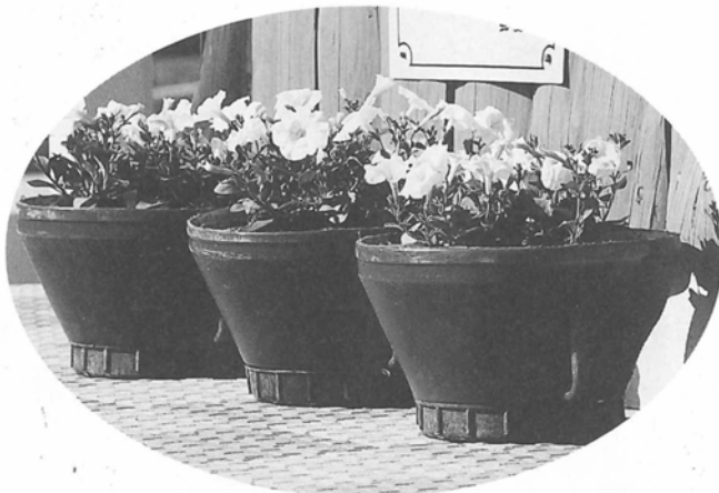
玉松海水浴場トイレ前