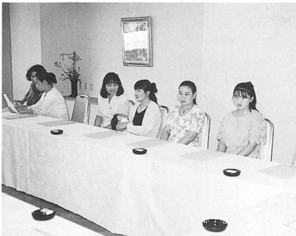
中国花嫁と研修生の皆さん

しています。また、町内の未婚者は、男女合わせて約五百人で、そのうち、三十五歳以上の男性が約二百人います。「りんどう」の花、日本一の生産量を誇る安代町。結婚相談所に期待する熱意とその予算も超一流です。わが村としても国際結婚の申し込みがあれば、安代町の指導等を受けながら進めてみたいと考えています。