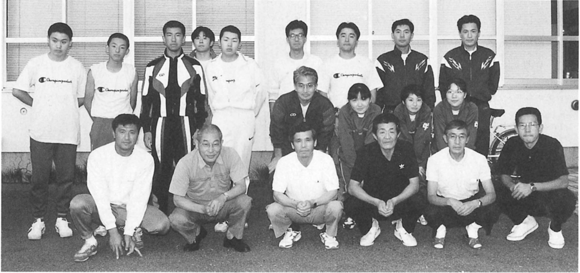
写真は昨年の選手団