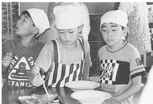
サクおにぎりを作るんだ！

かに会話も弾み、どの子ども皆一生懸命で輝いていました。今年度は男の子の参加が多くどのメニューも力作ばかり。人気は青のりフライドポテトでおかわりの列ができたほどです。普段嫌いな野菜も皆につられて食べる姿にビックリするお母さんもいます。子どもの時から気をつけて食事をすることが病気の予防につながることを学びました。