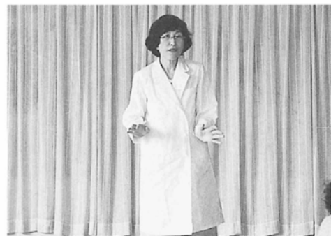
“油を減らすコツ教えます” 福士栄養士

点等具体的な指導があり、参加者は普段の自分の食生活を振り返る良い機会になったと話していました。