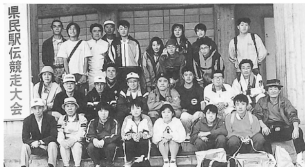
県民駅伝競走大会