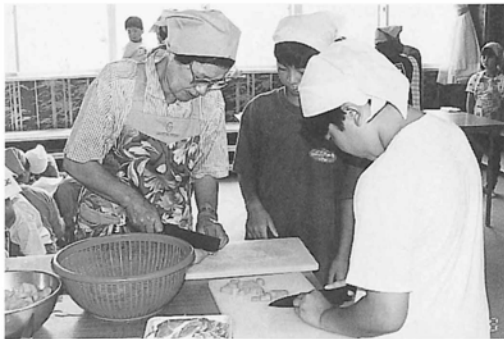
包丁さばきがうまい！

夏休みも終わりに近づいた8月21日、中央公民館において小学生27人とお母さん7人が、食生活改善推進員の皆さんと一緒に「母と子の料理教室」を開催し楽しい一日を過ごしました。作り方の説明の後、取り組んだメニューは、①カレー味ポークのブロッシュ②青のりフライドポテト③三色おむすび④ゼリーの4品。ワイワイ・ガヤガヤにぎや