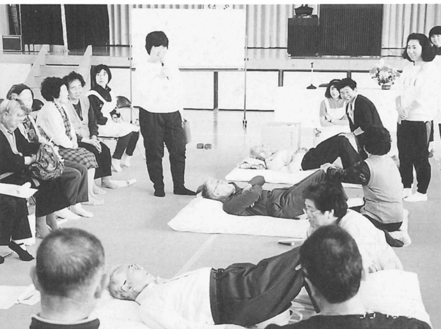
「福祉と健康まつり」の介護教室で寝たきり 状態を体験しているところです