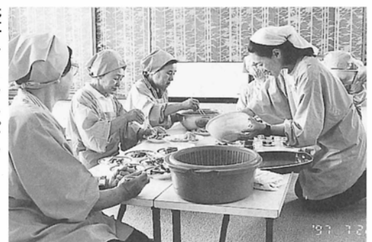
盛付けもテキパキと

普段から家庭でも子どもたちと一緒に楽しく食事作りをし、心と体の栄養と愛情をたっぷりとりましょう。