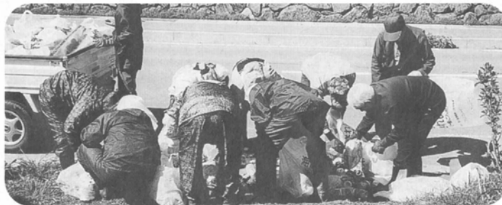
仕分けもひと苦労