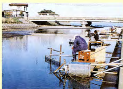
春の風物詩 シロウオ漁

お詫びと訂正 広報よもぎた5月号で誤り がありましたので訂正してお 詫びいたします。 ▼「お誕生おめでとうござい ます」