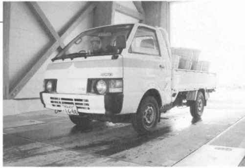
床に埋め込まれた状態のトラックスケール。トラックで載るだけで重さがわかる。