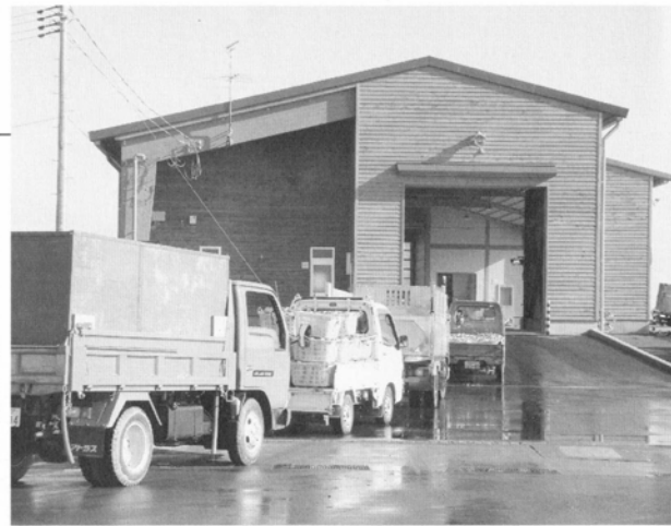
午前7時。出荷はこの時間帯に集中するため、順番待ちのトラックが列をつくる。