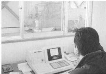
手前の機械に重さが表示される。運転手は降りる必要がない。