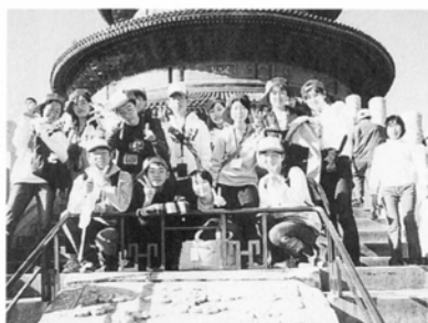
△天壇公園 祈年殿の前で

とんどなかった。食事もすべてターナーテーブル。それも慣れれば楽しく食べられた。もう一つ、自転車専用の大きい道路があったのもびっくりした。中国の学生は、やはり学問への熱心さは大変あった。言葉の壁はやはり厚かった。しかし、発音の悪い英語と少しだけ覚えた広東語で会話してみたら少しだけ通じた。その時の私はうれしくてうれしくてたまらなかった。