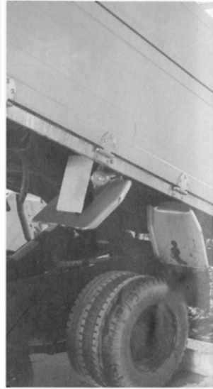
大型ベルトコンベアに