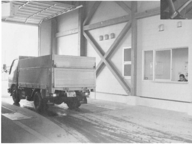
空になったトラックは、再びトラックスケールで重さを量って終了。