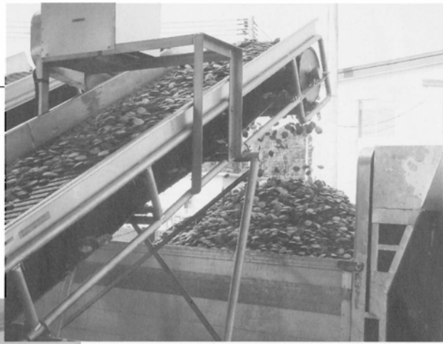
業者のダンプに積まれていく。