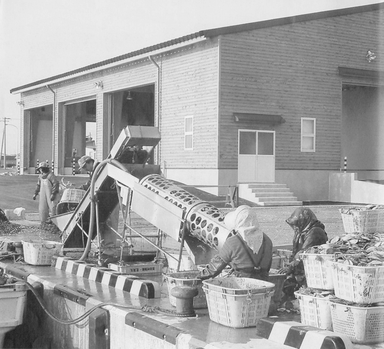
床面積582.48㎡、総工費1億3,251万円をかけた水産物荷さばき施設。潮風の影響を考慮し、木造建築。