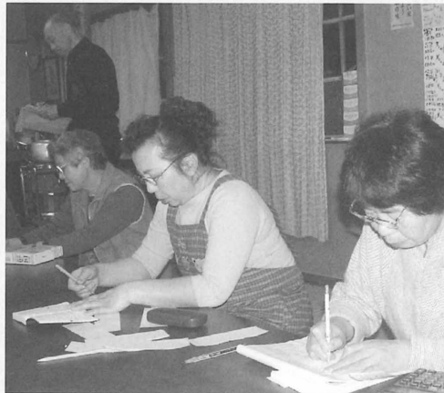
作品が出来るまで無言…。

ごとがなく自由に作れるところが魅力。自由な分、作った人の感性が浮き彫りにされるとも言えるのだが、日々の生活や世の中であった出来事から生まれる川柳。作り手や読み手の受け取り方によってさまざまに変化する。