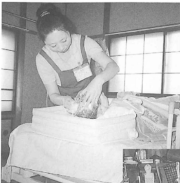
寝たきりの方の洗髪