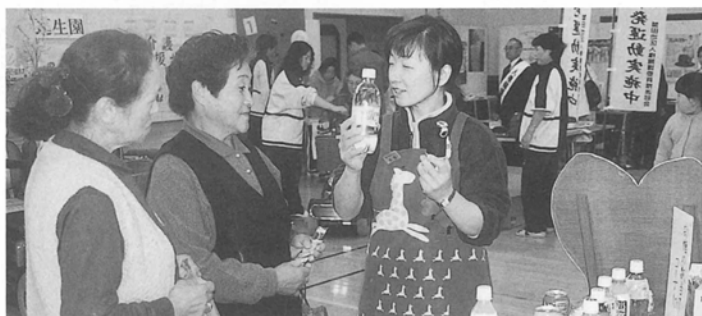
ジュースにはたくさんの砂糖が入っているんだよ！