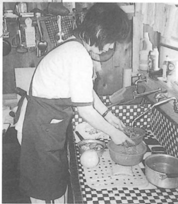
一人暮らしの方の調理

社協ヘルパーです。より安心、より確かなサービスを提供し、介護する人・される人が少しでも生活しやすいように、そして老後の不安を安心にかえて笑顔で過ごせるようにお手伝いさせていただきます。