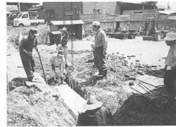
共同基地の水路修復 (広瀬)

蓬田村では、平成13年度の阿弥陀川地区から、平成14年度中沢、広瀬地区、平成15年度長科、高根地区、平成16年度蓬田、郷沢地区の実施に広まり、各地区では共同取組活動により農地の保全はもとより集落の環境整備など、交付金を有効に活用して地域づくりが進められました。