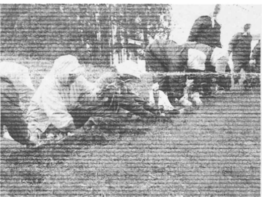
目指せ水仙まつり!水仙植樹

目指すは一〇、〇〇〇本。玉松カントリーパークを水仙でいっぱいにし、水仙まつりの開催を計画しているそうです。みなさんも一度古城の沼に足を運びきれいに植えられた水仙をご覧ください。