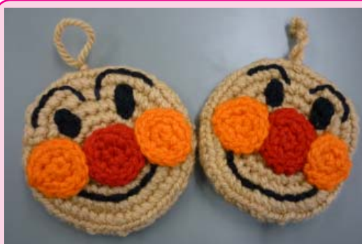
アニメキャラクターのエコタワシ