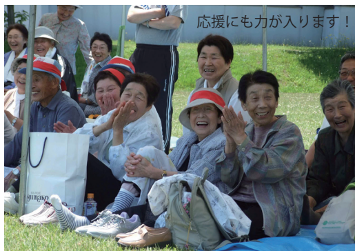
応援にも力が入ります!