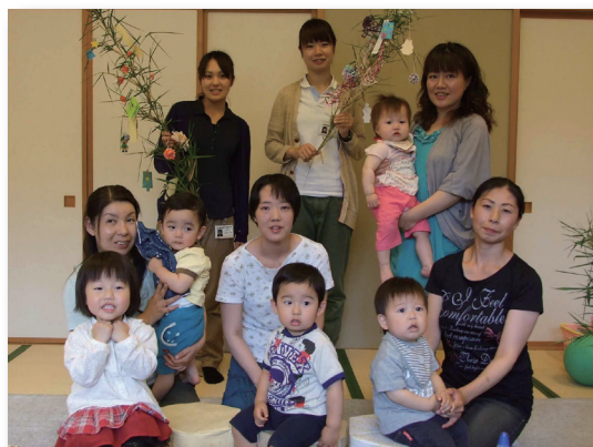
▲みんな何を願ったのかな?