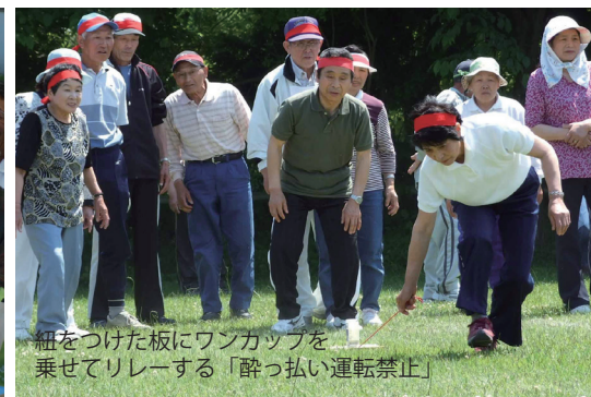
細をつけた板にワンカップを乗せてリレーする「酔っ払い運転禁止」