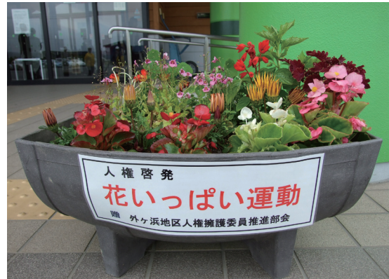
▲色鮮やかな8種類の花々。ぜひ小学校でご覧下さい

6月15日（金）、外ヶ浜地区人権擁護委員推進部会より、蓬田小学校へ人権の花プランターが贈られました。この運動は、花を育てることを通じて子ども達に生命の尊さを実感してもらい、優しさと思いやりの心を育てることを目的に毎年行われています。人権擁護委員の「大切に育ててください」という呼びかけに、児童たちは大きな声で「はい!」と返事していました。サルビアやナススタチウム、コリウスなど、様々な花が植えられたプランターが蓬田小学校の玄関を彩っていました。