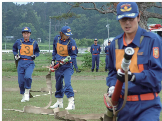
▲第七分団(広瀬地区)によるポンプ操法

会場では、地域防災の要として活躍している消防団員による機械器具点検やポンプ操法、瀬辺地漁港での一斉放水訓練など、日頃の訓練の成果が披露され、つめかけた村民からたくさんの拍手を受けていました。村民の生命と財産を守るため、士気を高めた1日となりました。