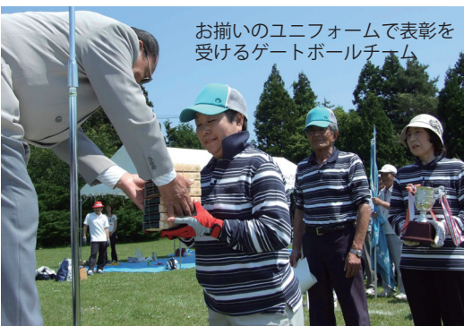
お揃いのユニフォームで表彰を受けるゲートボールチーム