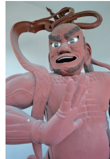
◀ 正門にある仁王尊像。後湯の大工が4年かけて彫ったそうです。

(意識: 私はこれまで日本の寺院を訪れたとき、外側だけしか見ることはできませんでした。内部は非常に神秘的で不気味で謎めいていて... いつも、お坊さんたちはそこで何をしているのか疑問でした。今回、お寺の中を見たことは本当に面白かったです。私は自転車で何回もお寺の前を通っていましたが、入り口を守っている怖い赤いモンスター「仁王尊像」に気づいたことはありませんでした。また、お寺の奥にこんなにも多くの仏像があるとは想像もしていませんでした。円空仏のような古い仏像を見るのが面白かったです。また、寺の入り口天井にある木彫りの古い彫刻にも感銘を受けました。)