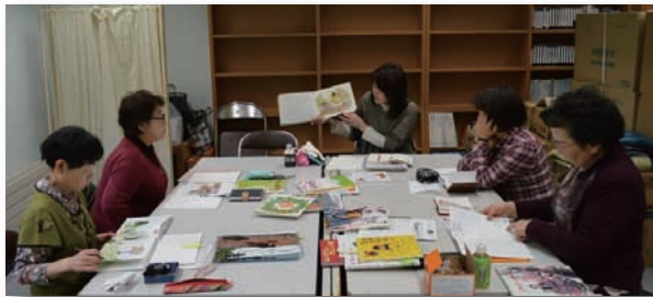
▲定例会の様子。絵本を持ち寄って会議をします。