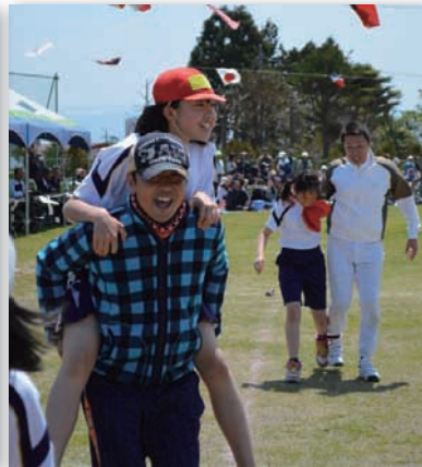
▲親子の絆で全力疾走。