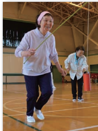
▲缶釣り競争はかなり難しく皆さん苦戦していました。