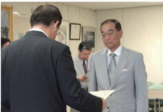
▲青森県知事より表彰を受ける古川村長。