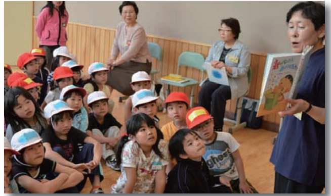
▲「昼読」の様子。集中して聞いている子ども達。

5月28日（火）小学校の昼休みの時間になると、音楽室に続々と児童が集まってきました。この日は楽しみにしていた「昼読」の日。約50名の児童が集まる中、赤いトマトの皆さんの絵本の読み聞かせが始まりました。終了後には児童達は「とても楽しかった！」と目を輝かせて話していました。