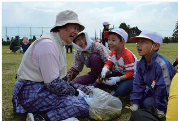
▲「授業より楽しい！」と子どもたち。

当日は晴天の中、参加した方々は草刈り機や鎌を使って慣れた手つきで草取りに励んでいました。児童と高齢者が一緒になって交流を深めながら作業に取り組み、世代を超えて楽しい時間を共有することができました。