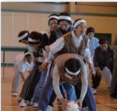
▲白熱したボール送り競争の様子。チームワークの良さが重要です。