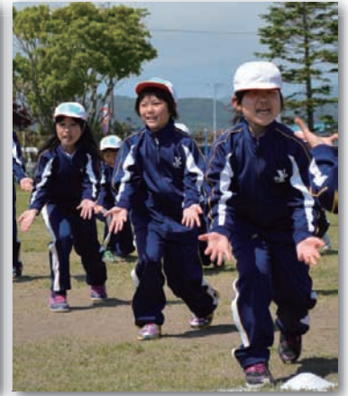
▲全校生徒でのよさこいソーラン ▲応援合戦「勝つのは"白でしょ"」