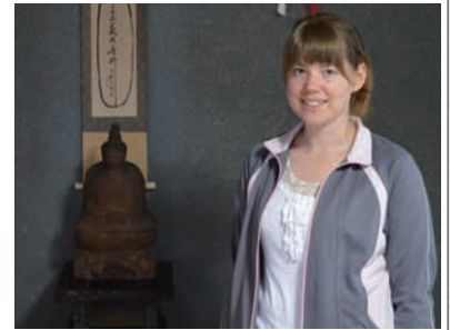
▲奥にあるのは円空仏。他にも多くの貴重な仏像がありました。