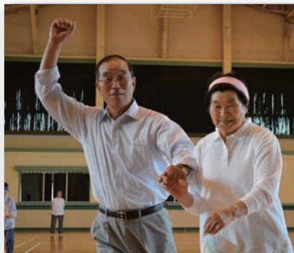
▲借り物競走では「古川村長」も借り出されました。