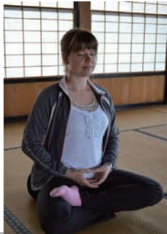
▲見事な姿勢で座禅。