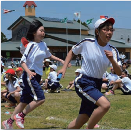
▲5・6年生のリレーの様子。