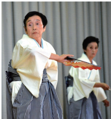
▲見事な踊りで観客を魅了