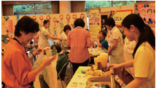
▼健康コーナーの様子