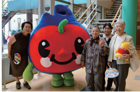
▼ゆるキャラと記念撮影