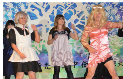
▲先生方は仮装し、パラパラダンスを披露

(意識: 私は、ステージ上に立つのは好きではありません。日本に来る前にそのようなダンスを学んだことはありませんでした。最初の練習の後、私にダンスはできないと思いました。しかし、何回か練習をした後に簡単になってきて、そして最後にはできるようになりました。)