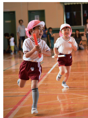
▲全力疾走のリレー