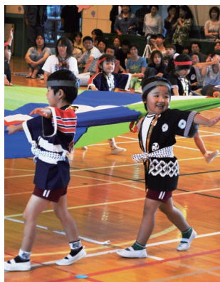
▲遊技「打ち上げ花火」

1歳児クラスから5歳児クラスまでの園児が、かけっこや綱引き、リレーの他、各クラスごとの遊技などを、応援に駆けつけた家族の前で力一杯に披露しました。ある保護者は「集団行動する子どもの姿を見て、成長を感じました」と満足げな様子で話していました。