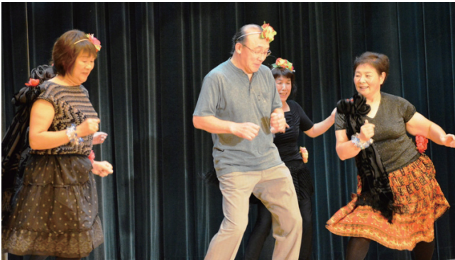
▼蓬田紳装ダンスの踊りでは会場が大爆笑に包まれました