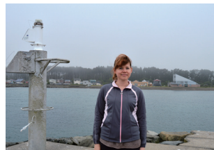
▲離岸堤の先端部には灯台

(意識：夏、果物と野菜を買いに海辺のマルシェに自転車で行くことが好きです。マルシェでは果物や面白い野菜やおいしそうに見える野菜をいつも買います。日本にはアメリカにはない野菜があるので、時々、それらの料理法をインターネットで調べます。買い物の後、時々、アイスクリームを買ってきらめく青い海のそばで食べます。そのときは蓬田にいてとても幸せであると感じます。)