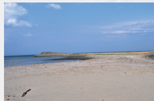
▲砂浜が離岸堤と繋がっています

潮の流れの影響で玉松海水浴場の海岸と離岸堤が陸続きとなりました。今回は特別に許可をもらって、離岸堤の様子を見に行ってみました。