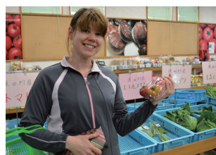
▲マルシェのトマトを購入

メリッサに行ってほしい場所などをお寄せ下さい。役場総務課企画財政班 ☎ 27-2111