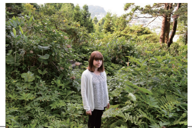
▲周りはアジサイの山(8月上旬が見頃です)

メリッサに行ってほしい場所などをお寄せ下さい。役場総務課企画財政班(☎ 27-2111)