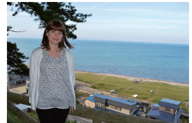
▲展望台からの広大な景色