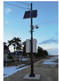
▲アクセスポイント設備