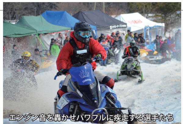
エンジン音を轟かせパワフルに疾走する選手たち

村営牧場で開催された第3回よもぎたチャレンジカップには150人ほどが集まり、最後の冬を楽しみました。スノーモービルでは、選手たちの迫力ある大ジャンプや華麗なテクニックで観客を沸かせたほか、そり大会では多くの子どもたちが歓声を上げながら滑走しました。また漁協からはホタテ焼きが無料で振る舞われ、参加者の体を温めました。