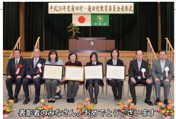
表彰者のみなさん、おめでとうございます

第64回青森県高等学校春季ハンドボール選手権大会において、第2位に入賞。また第67回青森県高等学校総合体育大会ハンドボール競技において、第2位に入賞。