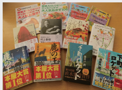
▲寒い冬にゆっくり読書はいかがですか？