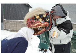
▶阿弥陀川稲荷神社の権現様

1月5日、無病息災、五穀豊穡を祈って、権現様が村内を練り歩きました。各地域の氏子らが獅子や神主に扮し、太鼓を鳴らしながら各世帯を訪問し、良い一年を祈念しました。