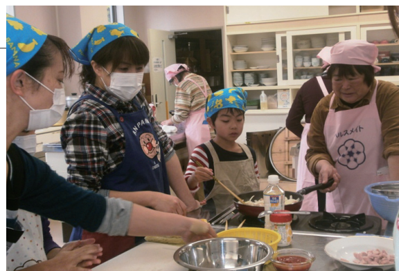
▲子どもも一生懸命に調理のお手伝い

食育について考える「おやこの食育」教室がふるさと総合センターで開催されました。参加した親子連れなど約20人は村食生活改善推進委員会の指導で、最近話題の「おにぎらず」や「鶏肉のトマトクリーム煮」など6品を親子で一緒に作りました。出来上がった料理を食べて「おいしくできたね」と親子で喜び合っていました。