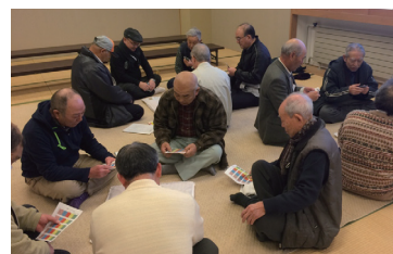
▲愛好者が親睦交流を深める村の大会