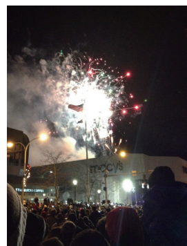
▲花火が上がって祝福します

（意訳：アメリカでは、大晦日に大きな祝賀会があります。12月31日の夜に、人々は友達や家族とパーティーに行きます。私の出身のホワイト・プレインズでは、道路で大きなパーティーをします。花火があがり、バンドの演奏があり、人々はダンスをします。12時をすぎると、みんなで "Happy New Year!" と叫び、カップルはキスをします。寒いけど、とても楽しいです。）