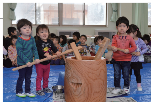
▲子どもたちが力を合わせてもちつきをしました

蓬田保育園で毎年恒例のもちつき会が行われ、子どもたちがもちつきを楽しみました。「よいしょ！よいしょ！」と元気な掛け声にあわせて、重い杵をふらつかせながら一生懸命に振り上げていました。つきたてのおもちはみんなで丸めて、あんこやきな粉をまぶしたり、お雑煮などにして美味しくいただきました。