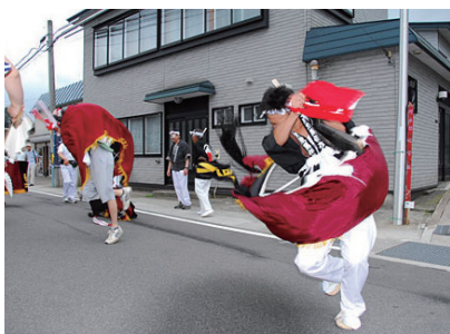
今別町の伝統芸能「荒馬」