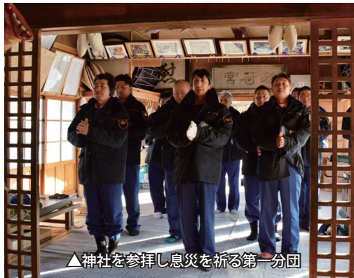
▲神社を参拝し息災を祈る第一分団