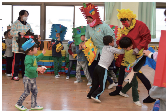
▲悲鳴の中で鬼に立ち向かう子もいました

2月3日の節分に合わせ、蓬田保育園で豆まき会が行われました。鬼のお面や帽子を被った園児たちは、豆まきの練習をして、和やかな時間を過ごしていました。しかし突然鬼が登場すると、園内は大騒ぎ。逃げ回る子や泣き叫ぶ子など様々でしたが「鬼はそと！福はうち！」と豆を投げつけ、鬼が退散したあとは笑顔が戻りました。