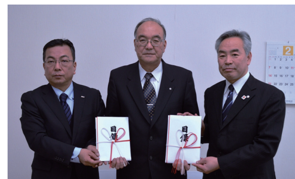
▲「本当にありがたい」と久慈村長