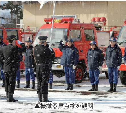
▲機械器具点検を観閲