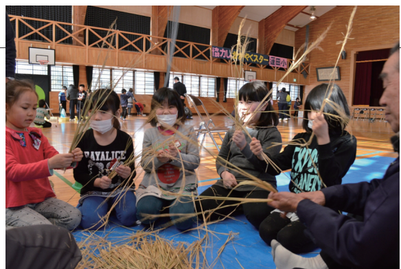
▲教わりながら、縄ないに挑戦する子どもたち

蓬小1・2年生が、お年寄りから竹馬やけん玉など、昔の遊びを教えてもらいました。お年寄りたちは子どもの頃を思い出して、お手玉の見本を見せたり、子どもたちも昔の遊びに新鮮な感覚で取り組むなど、たくさんの笑顔があふれていました。子どもたちは「遊びのコツを教えてもらって上手になった」と嬉しそうに話しました。