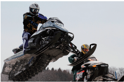
▲大迫力のスノーモビル大会