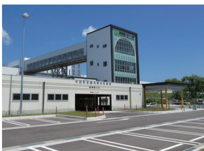
トンネルをデザインした奥津軽いまべつ駅