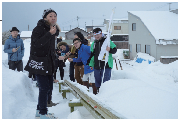
▲雪の中、流しトマトを体験するツアー参加者

北海道新幹線奥津軽いまべつ駅開業対策実行委員会主催で、東青地域の観光資源をPRする「東青魅力満喫ツアー」が行われ、雑誌編集者やCMディレクターら7人がマルシェを訪れました。一行はブランドトマトを使ったパスタの試食や流しトマトを体験したりして大いに盛り上がり、地域の魅力を生かした作品づくりの参考にしていました。