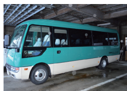
▲きれいな緑色のバスです

村コミュニティバスの老朽化のため、「原子力施設立地振興対策事業助成金」を活用し、新しいバスを購入しました。コミュニティバスは1乗車100円で村内や外ヶ浜中央病院などを巡回しています。どなたでもご利用可能です。