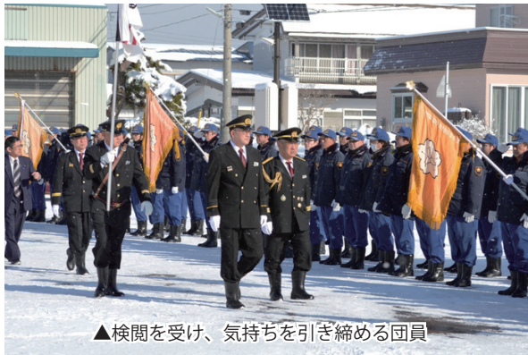
▲検閲を受け、気持ちを引き締める団員