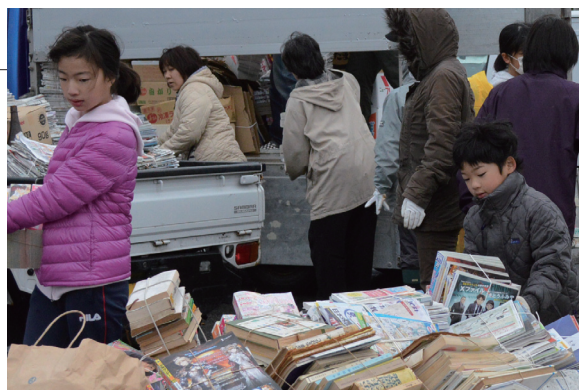
▲みぞれが降る中、白い息を吐きながら作業しました

回収された古新聞や空ビンは、ふるさと総合センター駐車場に集積し、再資源化するために回収業者に引き渡されました。今後も地域の資源回収活動にご協力下さい。