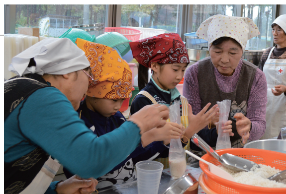
▲袋でご飯が炊けることに興味津々

蓬田村赤十字奉仕団・小学校合同研修会がふるさと総合センターで開催されました。ハイゼックスという非常用炊飯袋での炊き出し体験や、倒れた人を布を使って安全に運ぶ救急法の実技実習を行いました。災害時に力を合わせて食事を提供したり、生命を守る具体的な救急法など、奉仕団の活動を学びました。