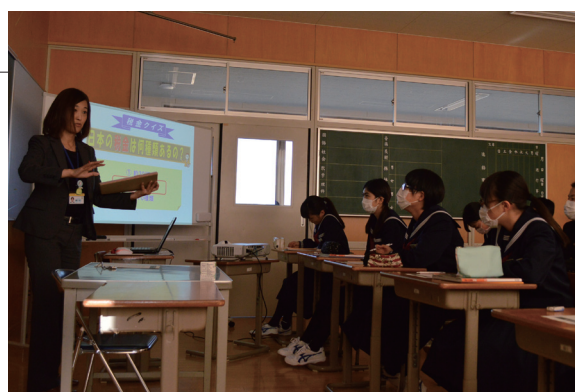
▲日本の税金は約50種類あると知り、驚いていました

青森税務署職員と村税務課職員が合同で、蓬中3年生を対象に租税教室を行いました。税金の種類や役割、国や村の財政を支える税金が私たちの生活にどのように関わっているのかをDVDを交えながら授業しました。生徒たちは、税金によって私たちの生活が暮らしやすいものになっていることを学びました。