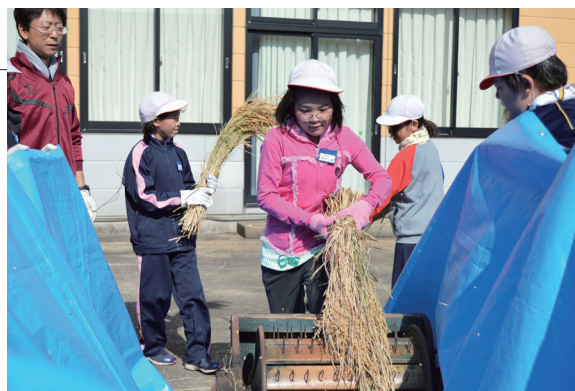
▲もみ殻が外れる軽快な音が響きます

稲刈り、天日干しから約3週間後、蓬小5年生が足踏み脱穀機を使った昔ながらの脱穀を体験しました。踏むタイミングが難しく苦戦しながらの作業でしたが、先人の苦勞と知恵を学ぶ貴重な体験となりました。また、米作りの一連の作業を体験し、農業の大変さやお米の大切さを学びました。