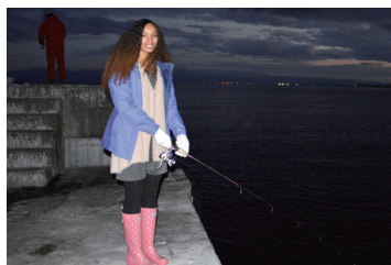
▲夕日を見ながら待ち続けます

(意訳：私の初めての釣りはここ蓬田村でした。小さなタコが村の近くの海で釣ることができるので、やってみませんかと誘われました。釣りの経験がないにもかかわらず、私はタコ釣りに行くのがとても楽しみでした。ロッドを使うことが驚くほど簡単だとわかりましたが、タコを一匹も捕えることができませんでした。それにもかかわらず、タコ釣りはとても面白くて楽しい経験でした。春が来たら、また釣りをしに行つて、魚を捕まえられることを楽しみにしています。)