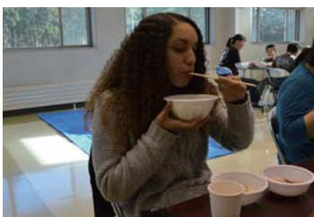
▲おしるこ、きな粉、お雑煮を堪能

I decided to spend my winter holidays in Japan, specifically New Year's in Tokyo, but when I heard that the village had a mochi pounding event, I had to go. Despite the fact that I find mochi to be very delicious, I have never made mochi before. Trying it out myself, I found that the hammer was very heavy, making it really difficult to pound the mochi. When I saw others do it, I was amazed at their strength. My favorite was probably the mochi with the anko beans, but the mochi in the savory soup was also very good. I am very happy that I got to try pounding mochi. It was really fun!