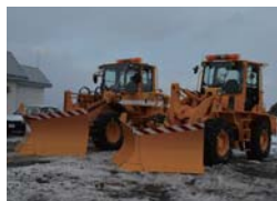
▲ドーザ型除雪車両2台

広報12月号の「特集！除雪」でお伝えしました平成28年度購入の除雪車両2台が、12月14日(水)に納車されました。ドーザ型除雪車両6台、グレーダー1台、ロータリー車1台の合計8台で除雪作業を行っています。