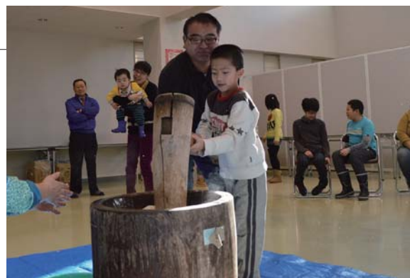
▲だんだんお餅が出来上がっていく様子に興味津々

ふるさと総合センターにおいて年末恒例のもちつき大会が行われ、約20名の親子が参加しました。子どもたちは大人に手を添えてもらい、臼の真ん中をめがけて餅をつきました。ついたお餅は全員で小さく丸め、おしるこ、きな粉、お雑煮にして食べました。やわらかくておいしいと何度もおかわりする子どもの姿が見られました。