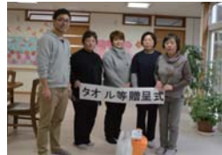
▲グループホーム蓬々