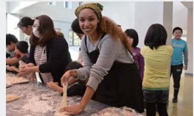
▲お餅の感触が「おもろい」

日本のお正月に欠かせない食べ物といえばお餅。今回、アシユリーには杵と臼を使った餅つきに挑戦してもらい、つきたてのお餅を食べてもらいました。