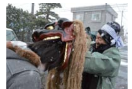
▲蓬田村権現様保存会

1月5日(木)、権現様が各戸を回り、獅子頭によって五穀豊穡と無病息災が祈禱されました。蓬田地区の施設「夢の里」では、職員と利用者が今年一年の無病息災を祈って、一人ひとり権現様の口で頭を噛んでもらいました。