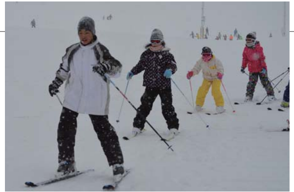
▲きれいに列を作り頂上から滑り降りてきます

1月10日(火)から12日(木)までの3日間にわたりモヤヒルズと青森スプリング・スキーリゾートで村民スキー教室が開催され、約60名の蓬小生が参加しました。雪不足が心配されましたがゲレンデには十分な積雪があり、グループに分かれた児童たちは蓬田スキークラブの指導のもと、それぞれのスキーを楽しみました。