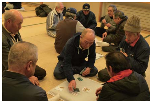
▲相手の手を探りながら札を打ちます