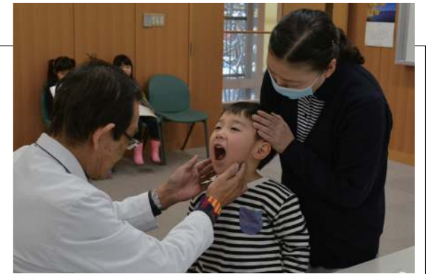
▲どの子も行儀良く健診を受けていました

来年度蓬田小学校へ入学予定の児童を対象に、ふるさと総合センターにおいて就学時健康診断が行われました。男児 11 名、女児 7 名の計 18 名は、安全帽のサイズ確認や、内科、歯科、視力、聴力検査などを受けました。子どもたちは「明日から小学生になれるのかな」などと話し、小学校入学を待ち遠しそうにしていました。