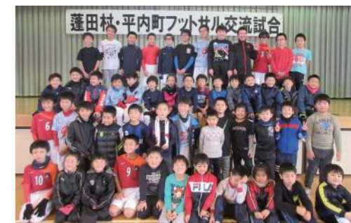
12月10日（日）、平内町との交流試合を開催 平成30年6月にはサッカーワールドカップも開催されます。人気のスポーツを体験しませんか？

■用意するものは？ 基本運動できる服装で運動靴とスポーツタオル、水分補給用の飲物を持参していただきます。 ■会費は？ よもっと元気スポーツクラブの会員（3,000円/年）であれば何回でも参加可能です。それ以外の方は1回につき、200円で参加できます。