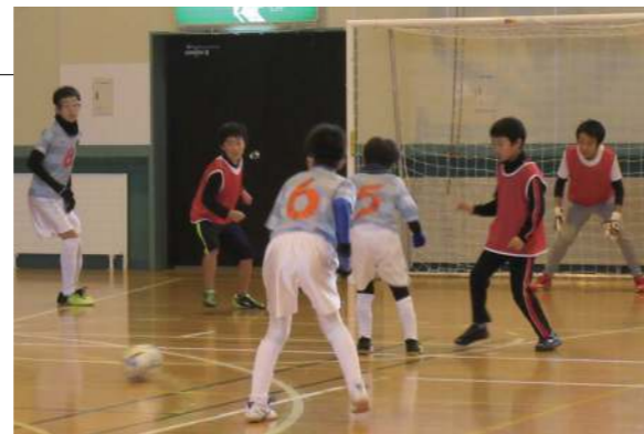
▲初めての交流試合で生き生きとしたプレーをみせました

よもっと元気スポーツクラブの一つであるフットサルクラブが、平内町と交流試合を行いました。会場のトレーニングセンターには両チーム合わせて 50 名以上の小学生が集まり、基礎練習や試合を楽しみました。最後は、当村と平内町と混合のチーム編成で試合をして、新しい仲間との親睦を深めました。