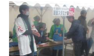
南部町の「あおり鍋自慢」に出展。連合婦人会が考案した「蓬田スタミナ鍋（無臭にんにく入り）」を販売して、村をPRしました。