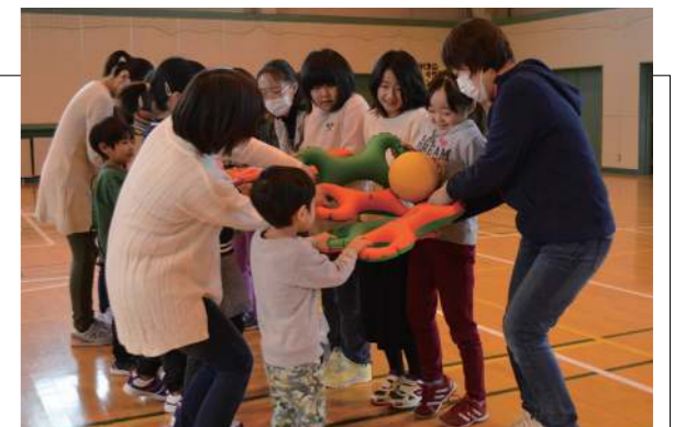
▲「ベル」という用具を使って親子でボール送りをしました

子ども会冬季ゲーム大会がトレーニングセンターで行われ、約 20 名の子どもたちが参加しました。「3B体操」という遊びの要素を取り入れた体操では、音楽に合わせて踊ったり、用具を使ってゲームをしたりしました。終了後には漁協女性部からホタテや豚汁などの昼食の提供があり、子どもたちは大変喜んでいました。