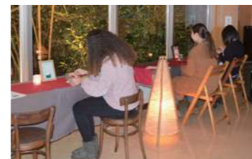
▲景色を見ながらケーキを食べました

I recently participated in a coffee making event held at the Furusato Center. I learned about how to make delicious tasting drip coffee and got to try grinding coffee beans. Although I don't drink coffee often, it was very fun to be around so many people who enjoy and are interested in coffee. My mother loves coffee too, so when I go back to the USA for Christmas, I will tell her everything I learned at this event!