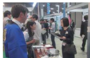
10月に東京で行われたイベントでは、弘前大学と共同研究を行っている循環型農業の紹介をしました。