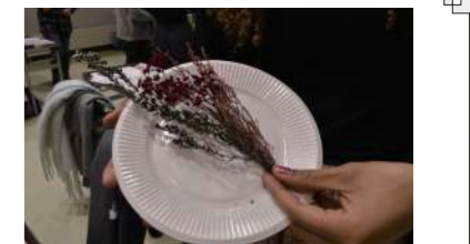
▲赤や緑色の草花を選びました

This past January, I participated in a herbarium making event at the Furusato Center. I had never made something like that before, so I was very nervous. I picked the plants I wanted and carefully placed them into a glass bottle. After filling the bottle with oil, I realized I had done a pretty good job! I am really happy with how my herbarium turned out. I hope I get to create more interesting things at village events in the future!