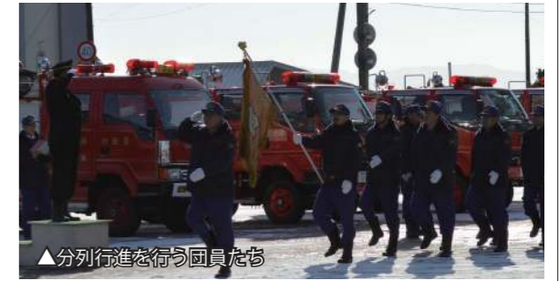
▲分列行進を行う団員たち