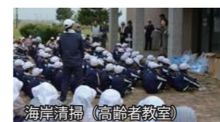
海岸清掃（高齢者教室）

教育課は教育長をトップとする教育委員会の中の組織で、職務上役場とは一線を画しています。教育長、課長以下5名の職員で構成され、その業務は学校教育や社会教育の振興、文化施設やスポーツ施設の管理など多岐にわたります。