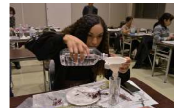
▲草花を入れた瓶にオイルを注ぎます

This past January, I participated in a herbarium making event at the Furusato Center. I had never made something like that before, so I was very nervous. I picked the plants I wanted and carefully placed them into a glass bottle. After filling the bottle with oil, I realized I had done a pretty good job! I am really happy with how my herbarium turned out. I hope I get to create more interesting things at village events in the future!