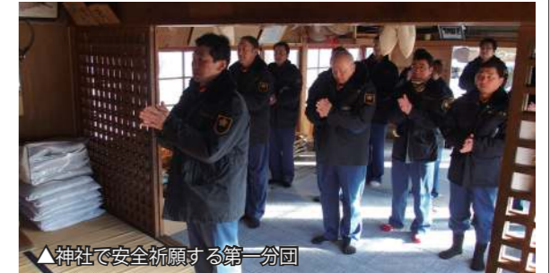
▲神社で安全祈願する第一分団