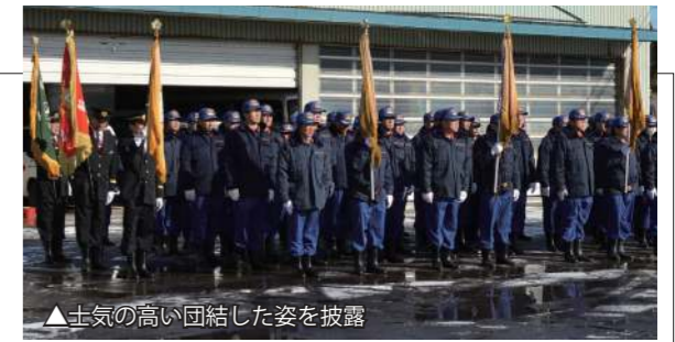
▲士気の高い団結した姿を披露

新年最初の演習である平成30年蓬田村消防団出初め式が役場前で挙行され、消防団員約130名、消防車両8台が出動しました。消防関係者が見守る中、観閲者である久慈村長から検閲を受け、分列行進や機械器具点検を行った団員は、今年一年の安全祈願と消防活動に対する士気を高めました。式終了後、団員たちは消防車に乗り、村内をパレードして防火を呼びかけました。