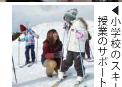
小学校のスキー授業のサポート

教育課は幅広い方々へ、学びや体験を通じて日々の生活の充実を図るためのお手伝いをしています。またスポーツを行うことで心身のリフレッシュと健康増進に繋がる事業も行っています。各種事業に興味のある方は教育課までお問い合わせください。