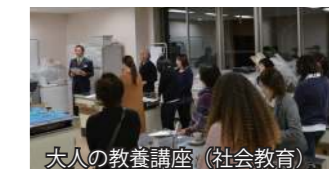
大人の教養講座（社会教育）