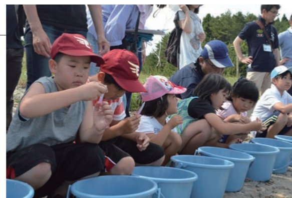
▲水質検査キットを使用し検査の反応をみる児童たち

むつ湾広域連携協議会主催、バイ・クリーンアッププロジェクト実行委員会等の協力のもと、環境活動体験会が行われました。むつ湾沿岸市町村の小学生は、広瀬地区で海岸清掃や水質調査を行ったり、瀬辺地漁港でヒラメの稚魚の放流やシーカヤックを体験し、むつ湾の豊かさや面白さを感じ、むつ湾についての理解を深めました。