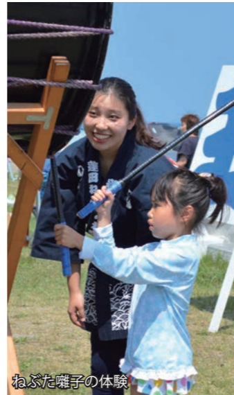
ねぶた囃子の体験