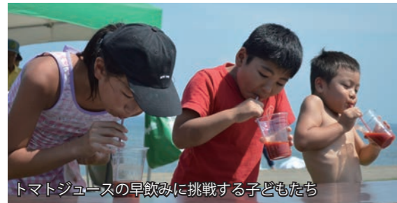
トマトジュースの早飲み挑戦する子どもたち