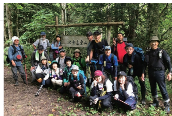
▲下山後、みなさん良い笑顔で記念撮影

8月11日の山の日になみ、大倉山好会が企画する登山体験会が行われました。村内外から参加者が集まり、大倉山好会の会員含め総勢19名で大倉岳山頂を目指しました。気温が低めで涼しく、快適な登山となり、3時間程で山頂に到着しました。参加者は夏山の雄大な自然を楽しみながら、大倉岳登山を満喫していました。