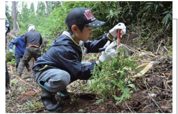
▲植樹した木の隣に自分の名前を書いた木の札を立てました

子ども会リーダー研修会において、農林中央金庫の社会貢献活動の一環としてヒバの植樹が行われました。32名の小中学生が森林管理署などの指導のもと、村内の国有林の伐採跡地にヒバの苗木200本を植えました。参加者は自然と触れ合う素晴らしい時間を共有し、未来へ繋がる貴重な体験をしました。