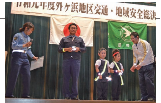
▲保育園児をモデルに反射材の効果を確認しました

安全で住みよい地域社会の実現を目的として、ふるさと総合センターで外ヶ浜地区交通・地域安全総決起大会が開催されました。村内外から関係者約200名が出席し、事故や犯罪のない地域づくりに向けて決意を新たにしました。式典後のアトラクションでは、警察音楽隊の演奏やカラーガード隊の演技が会場を盛り上げました。