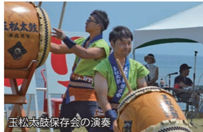
玉松太鼓保存会の演奏