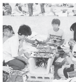
▲よもぎた産業まつり