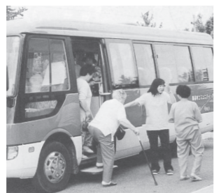
▲コミュニティバス運行