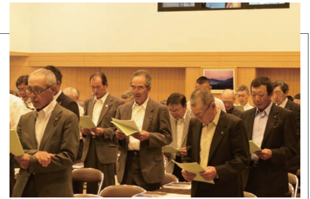
▲農業委員会憲章を唱和する出席者

東青地区農業委員会大会がふるさと総合センターで開催され、東青地区の農業委員や農地利用最適化推進委員など100名以上が出席しました。大会では、永年勤続農業委員等の3名を表彰するとともに、農地の基盤整備の推進や鳥獣被害対策など4議案について審議し、最後は大会宣言で締めくくりました。