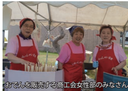
おでんを販売する商工会女性部のみなさん