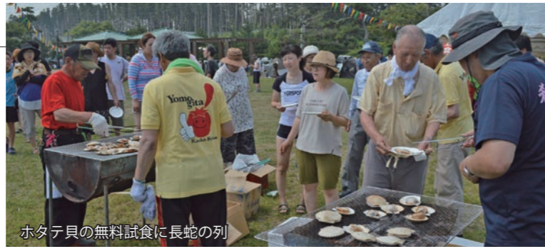
ホタテ貝の無料試食に長蛇の列

快晴に恵まれた玉松海水浴場で、第25回玉松海まつりが開催され、村内外から多くの来場者が詰めかけました。宝探しゲームやトマトジュース早飲み大会などのイベントのほか、玉松太鼓保存会やねぶた囃子愛好会による演奏などのアトラクションも行われ、来場者を楽しませていました。また、飲食コーナーの焼きそばやかき氷、ホタテの無料試食には長蛇の列ができたほか、建築組合による包丁研ぎも大好評で、大盛況のうちに幕を閉じました。