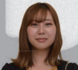
ふくい ゆの (阿弥陀川)

顔を合わせる時間が減ってしまいましたが、毎日家族のことを思っています。これからもよろしくお願いします。