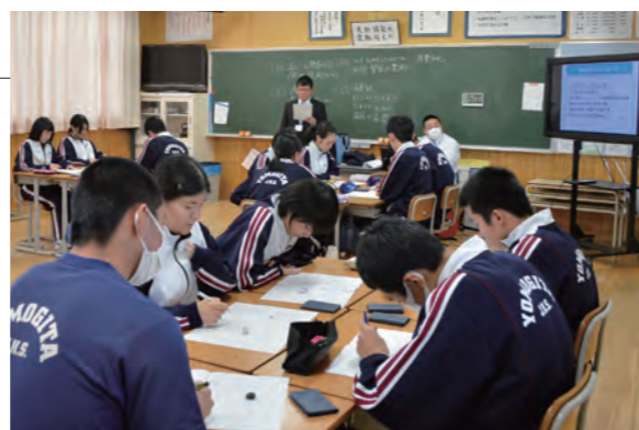
▲「公平な税金の集め方」についてグループで考えました

税の意義や役割を正しく理解してもらうことを目的に、蓬田中学校3年生を対象とした租税教室が行われました。村税務課職員が講師となり、税の仕組みや村税の使い道などを解説しました。また、税金をどのように負担するのが公平なのかを具体例で考えました。生徒たちは積極的に意見を出し合い、税について理解を深めました。