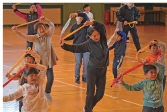
▲ベルターという道具を使い、音楽に合わせて踊りました

トレーニングセンターで子ども会冬季レクリエーション大会が行われました。参加した約40名の親子は、専用の用具を使って体を動かす「3B体操」や青森県レクリエーション協会によるゲームで汗を流しました。また、漁協女性部が提供したおにぎりや豚汁などの昼食後も、ゲーム遊びで身体を動かし、楽しい時間を過ごしました。