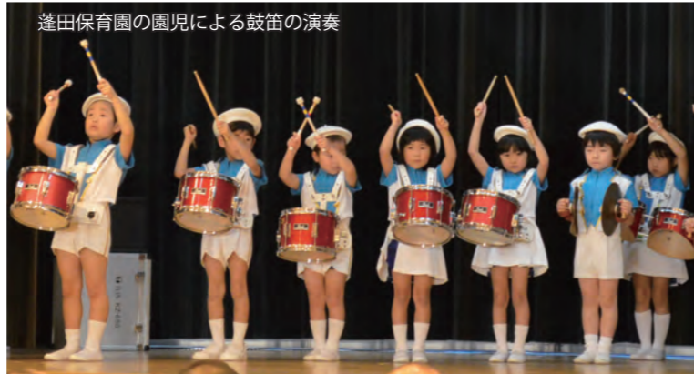
蓬田保育園の園児による鼓笛の演奏