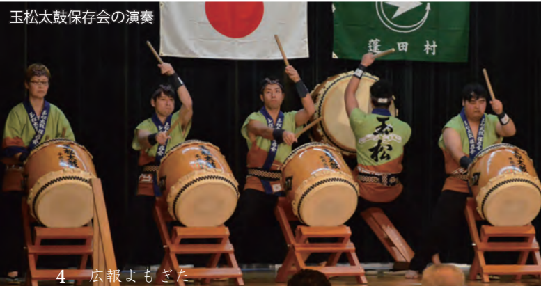
玉松太鼓保存会の演奏