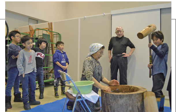
▲一人一人の力で美味しいお餅が出来上がりました

ふるさと総合センターで、年末恒例のもちつき交流会が行われ、約40名の親子が参加しました。子どもたちは「よいしょ」のかけ声に合わせて、楽しみながら餅をつきました。つき上がった餅は、みんなで小さく丸め、雑煮やきなこ、おしるこに調理しました。親子仲良くつきたての餅をほお張り、一足早く正月気分を味わいました。