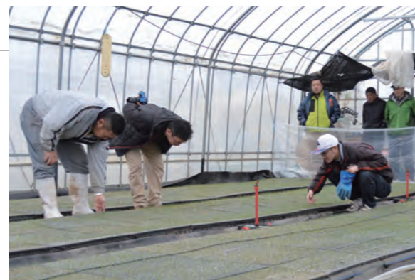
▲ハウス一面に広がる苗の状況を丁寧に確認していました