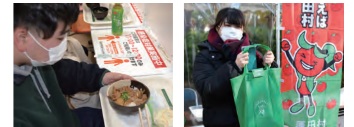
▲トマツタレを使用した牛焼肉丼 ▲大学関係者を通じて学生200人が学生食堂で販売されました へ特産品が手渡されました