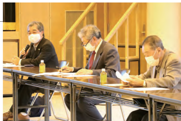
▲各自治会長から多くの意見を頂きました

Q ○蓬田川の雑木・土砂の除去について(蓬田自治会)平成28年から行われてきた雑木と土砂の除去について、今後の継続と予算増額を要望します。