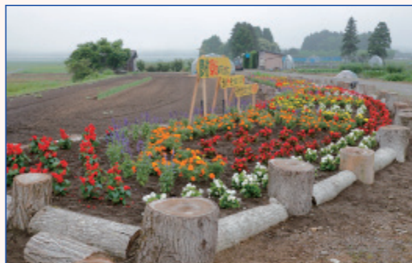
令和2年度 花壇部門 最優秀賞