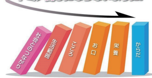
～社会とのつながりを失うことがフレイルの最初の入口です～

蓬田村ではフレイル予防をはじめとした介護予防の取り組みとして、高齢者教室やいきいきなどわどサロンを開催し、住民の方の介護予防活動の手助けを行っています。また、地域で介護予防活動に取り組みたい方の手助けも行っています。興味がある方は役場住民課（☎27・2112）までご連絡ください。