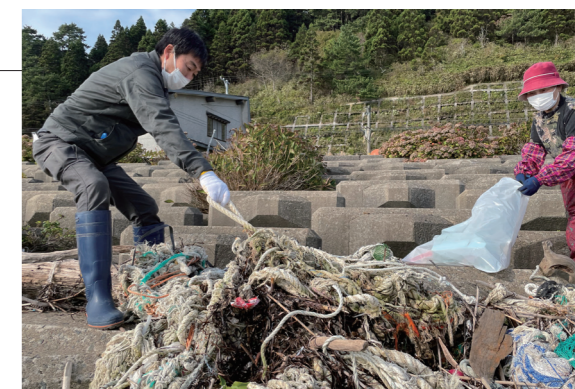
▲絡まった漁具のロープは回収するのが大変でした

広瀬自治会主催の海岸清掃が行われ、地区の住民23名が参加しました。参加者は、午前8時に黒岩バス回転所から作業を開始し、海岸に漂着したペットボトルや発砲スチロール、漁具などを回収しました。3時間の作業で大量の漂着ごみが回収され、環境保全と良好な景観形成が図られました。