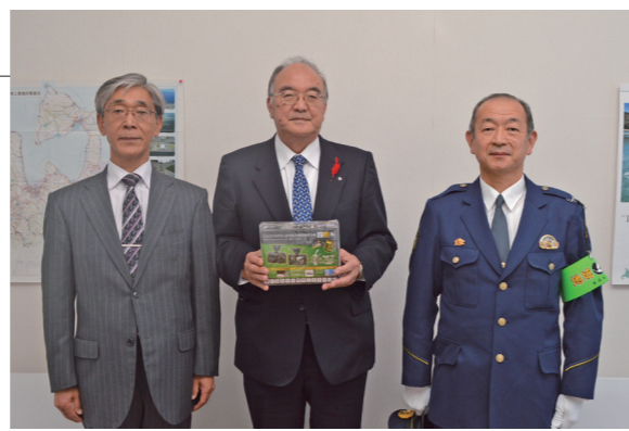
▲温かい厚意に感謝します

外ヶ浜地区防犯協会と外ヶ浜警察署では、犯罪の未然防止や迷い高齢者の早期保護等の観点から自治体運営のバスにドライブレコーダーを設置する取り組みを進めています。この取組の一環として、青森県遊技業防犯協力会青森支部から蓬田村へドライブレコーダー2台を寄贈いただきました。これらは、スクールバス2台に設置されています。