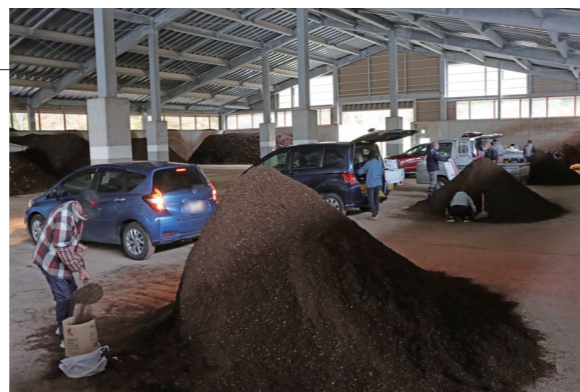
▲ひっきりなしに車が訪れていました

11月1、2日と11月4日から6日の計5日間、村外の方を対象に、ホタテガイ養殖残渣堆肥処理施設で堆肥の無償配布が行われました。午前9時前には堆肥を求める車の列ができ、葉物野菜や花に使ってみて良かったと話すリピーターの方が多く訪れていました。5日間で374台の車が施設を訪れ、約118トンの堆肥が配布されました。