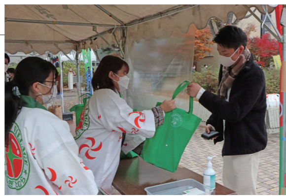
▲役場職員と学生アルバイトが特産品の配布を行いました

弘前大学と包括連携協定を結んでいる15市町村が「地元産品を使用した食支援プロジェクト」に参加し、コロナ禍に苦しむ学生に特産品を提供しました。当村はトマト加工品と玉ねぎのセットを学生200人分用意したほか、学生食堂へ蓬田トマト加工グループの焼き肉のタレ「トマッタレ」を80本提供し、トマッタレ牛丼に使用されました。