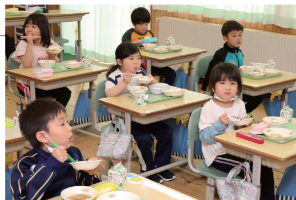
▲友達と一緒に食べる給食はとてもおいしいです

令和5年度より村の小・中学校では、給食費の無償化事業を開始しています。4月7日（金）の入学式から1ヶ月経った蓬田小学校1年生の皆さんは、給食の時間になると協力して配膳しながら、行儀良く席について友達と仲良くおいしそうに給食をほおぼっていました。