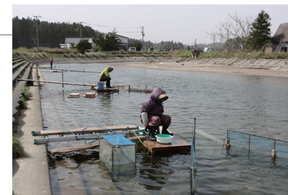
▲川沿いで漁の仕掛け「やな」を見守る組合員の皆さん

4月中旬から広瀬川の河口でしろうお漁が始まりました。広瀬川しろうお組合の組合員の皆さんが漁に参加し、満潮時の上げ潮に乗って海から遡上するしろうおを水揚げしていました。組合員は「今年は例年より早く遡上していて、天候や気温にもよるがキログラム単位で獲れる日もある」と話し、楽しそうにカゴを上げていました。