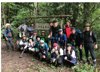
▲大倉岳登山口にて集合写真（2019年）