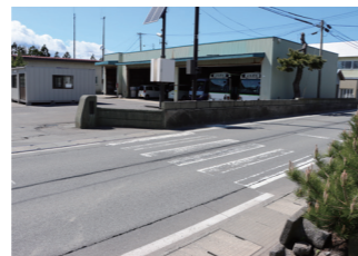
▲役場前の横断歩道の様子 歩行者が渡ろうとしていた場合 原則一時停止をしましょう

▶左記の方針を基に外ヶ浜警察でも調査を行います。その際、村民の皆さまにご意見を伺うこともありますので、ご理解ご協力をお願いします。