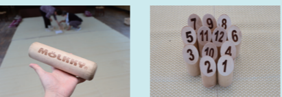
▲木製のモルック（左）とスキットルと呼ばれる的（右）

2チーム以上で競います。ポッチャと違ってこちらは、モルックと呼ばれる軽い木の棒をボウリングのように的に向かって投げて倒し、得点を競う競技です。点数の計算も必要となるため、頭の体操にもなります。※令和8年度おおもりの国スポのレクリエーションスポーツとして蓬田村ではモルックが実施されます。