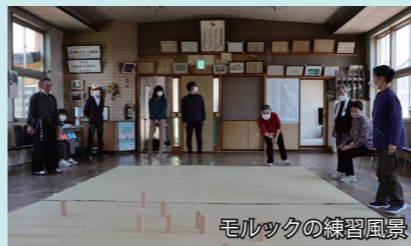
モルックの練習風景

興味のある方はお気軽に蓬田村社会福祉協議会までお問い合わせください。☎0174-27-2828