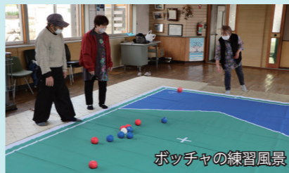
ポッチャの練習風景

赤球チーム（先攻）と青球チーム（後攻）に分かれ、赤玉チームが最初に投げたジャックボール（白球）に赤青それぞれのチームが球を投げてどれだけ近づけられるかを競います。戦略が非常に重要な球を投げて行くカーリングのような競技です。