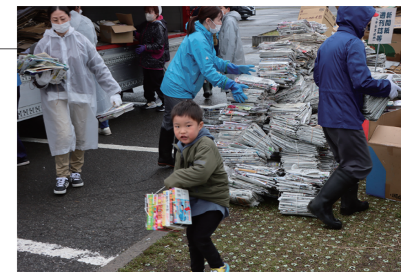
▲おとなも子どもも一緒になって廃品の集積をしました

春の子ども会・自治会合同廃品回収が行われました。あいにくの雨空でしたが、参加者は早朝から各家の前に出された古新聞や雑誌、段ボール等のリサイクル資源を集めて回り、ふるさと総合センターの駐車場に集積しました。集積した古新聞等は、再資源化のために回収業者に引き渡されました。