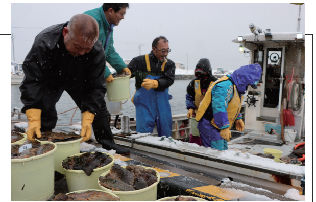
▲漁船から次々と上がるナマコをパレットに並べている様子

雪が深々と降り積もった早朝、蓬田漁港においてナマコ引きが行われました。蓬田漁協の裏手にある、荷捌き場において、漁師達が漁船や軽トラックで次々とバケツいっぱいに入ったナマコを納品しました。海水温の上昇によるホタテの不漁が懸念される中で、貴重な収入源の一つとして重宝されているようで、この日はパレット100枚程度が上がりました。