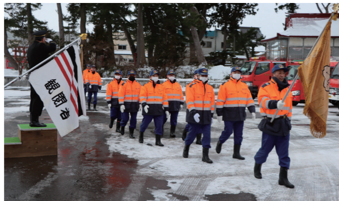
▲村長が観閲する中、規律ある分列行進を披露する第6分団員