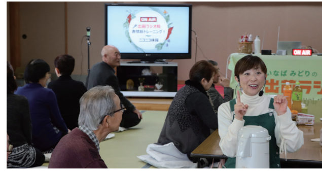
▲会場全体がラジオ局と化し、参加者全員と会話をしました