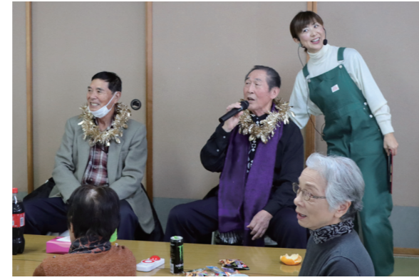
▲リクエスト曲がかかると力強い美声で熱唱する場面も