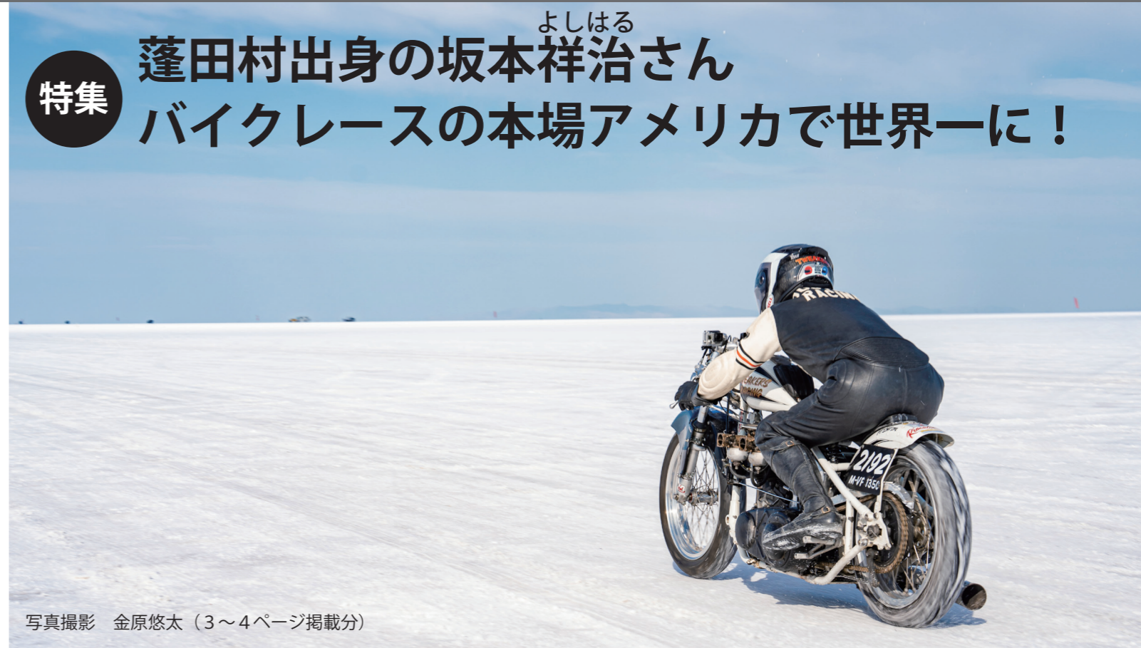
写真撮影 金原悠太 (3~4ページ掲載分)