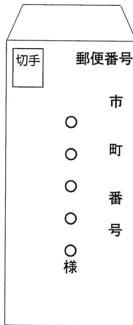
返信用封筒 (請求者宛) 請求通数が多い場合は角型2号(A4対応) の封筒をご用意ください