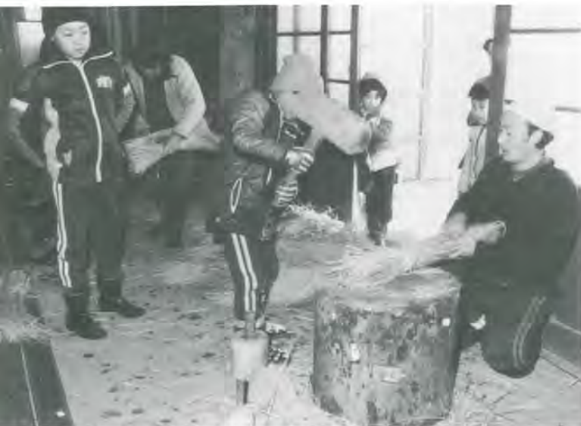
おかし、ワラ打ちは子どもの日課でした。

私たち世話人も研修に積極的に参加し、子どもたちの活動を暖かい目で見守っていきたいと思います。