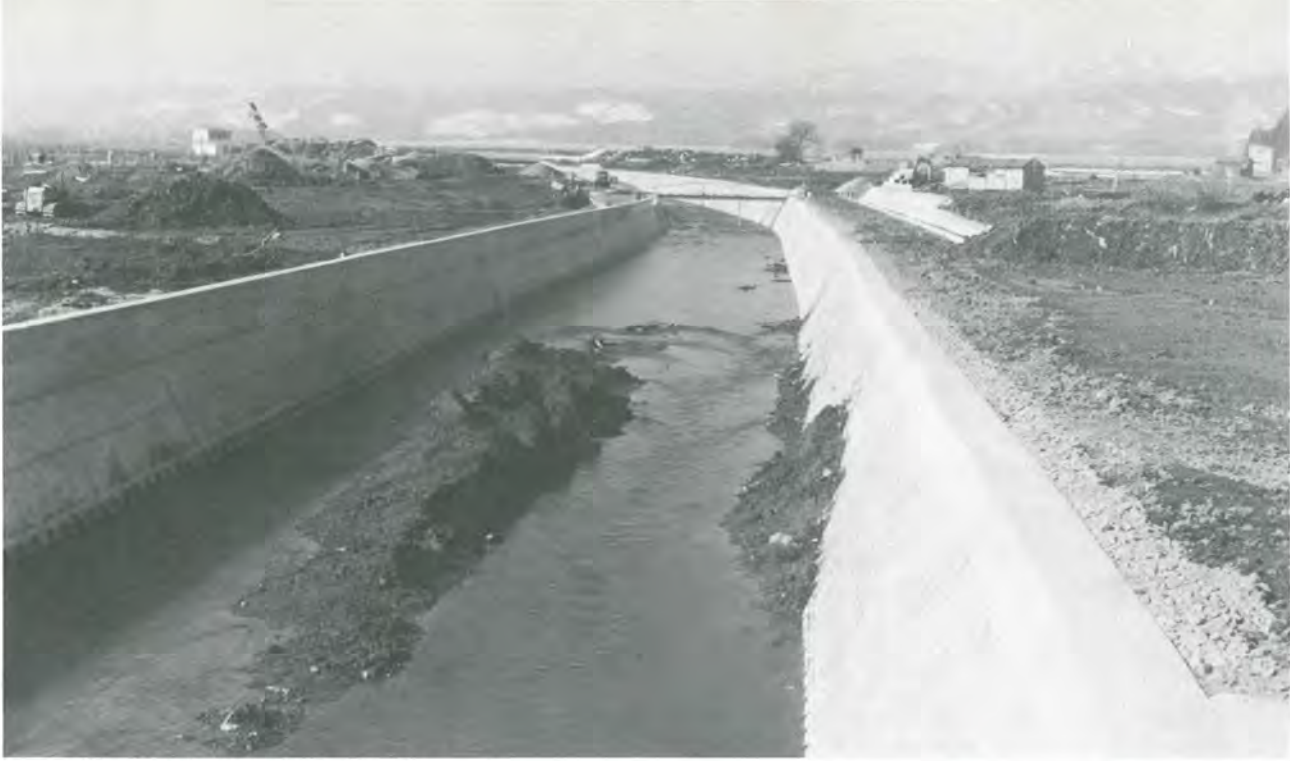
進行中の蓬田川災害復旧工事（昭54～）