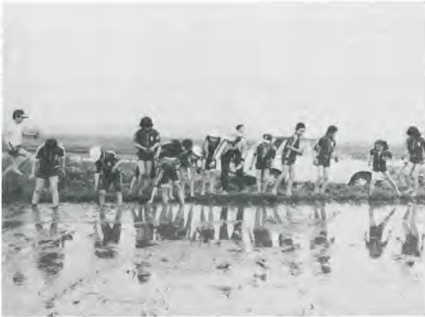
田植えの体験学習をする小学生

村の予算は、必ず確定したお 金を、それぞれの支出に当てる ことになるので、赤字がないの が原則です。 ほとんど概略的で、説明不足 の点が多いと思いますが、ここ で取り上げたことは、すべて村 民一人一人に何かの形でかわ り合いを持っている内容です。 よりよい生活と活気ある村づく りのために、みなさまの協力を お願いします。