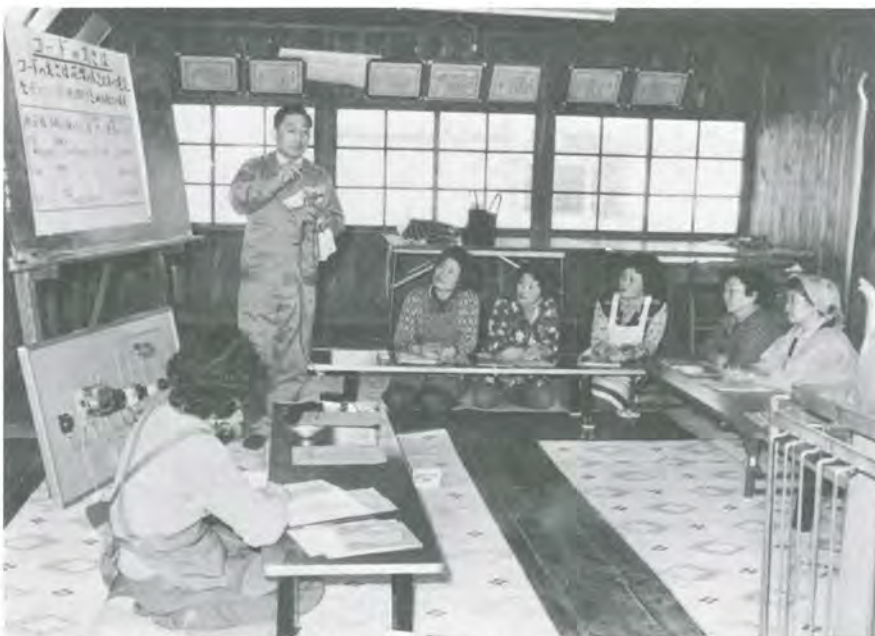
電気器具のコードも種類がいろいろあります。

炊事や洗たくのとき、テレビをつけっぱなしにしないことも、消エネのポイントですよ。