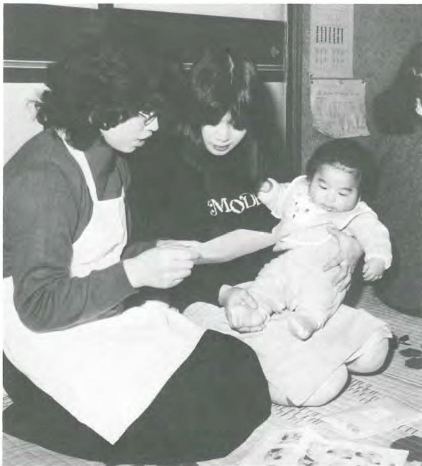
家族の健康管理はお母さんの役目です。