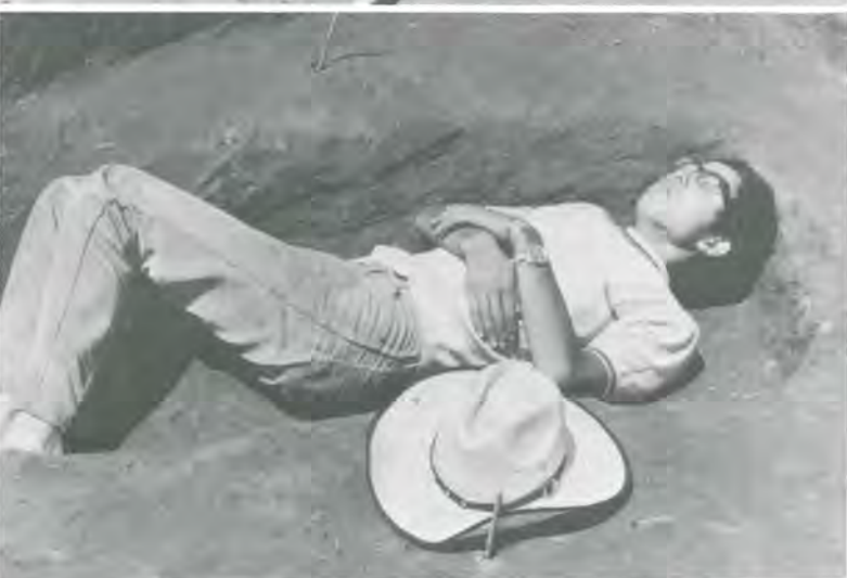
①小館遺跡からみつかった墓穴。