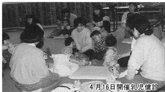
4月16日開催乳児健診