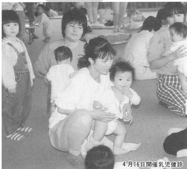
4月16日開催乳児健診

核家族化が進み、女性の社会進出が増え、出生率が低下している現在、子どもと家庭をめぐる状況は大きく変化しています。