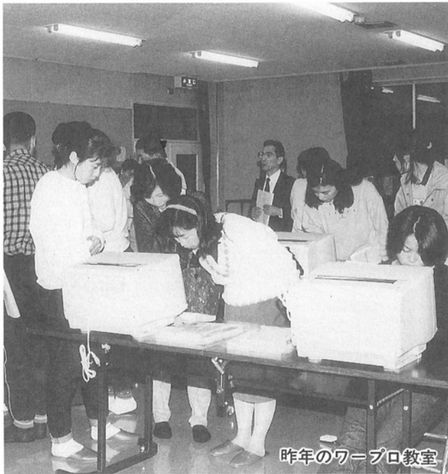
昨年のワープロ教室

急速に変化する情報化時代に対応するため、村の人たちに情報機器の操作技術を習得してもらおうと、ワープロを十五台、中央公民館に設置して、昨年五月にスタートしたワープロ教室も今年で二年目に入りました。 今年、第一期生は六月から約二ヶ月の予定で、毎週火曜日午後六時三十分から受講する予定になっております。また、第二期(八月〜九月)第三期(十一月〜十二月)開催予定の受講生がまだ定員になっておりませんので、受講したい方はどしどしどうぞ。 また、ワープロは毎週月曜日から土曜日までの開館時間中使用できますので、使用したい方は、事前に連絡下さい。 ☎二七二〇七六