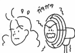
●回転するときに異常な音をする

それでも異常があれば、発煙・発火の恐れがありますので、すぐにプラグを抜いて使用を中止してください。再使用の際には、必ず販売店等にご相談ください。