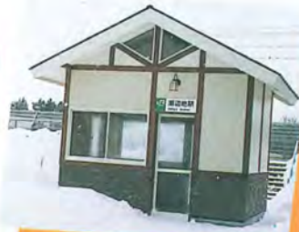
新しくなった瀬辺地駅