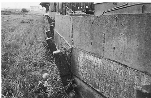
▲膨らんできている土留め