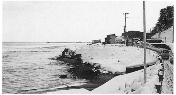
▲護岸整備の要望箇所