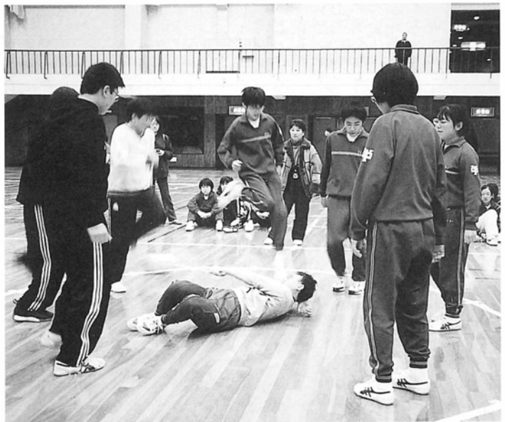
サークルジャンプにチャレンジ中