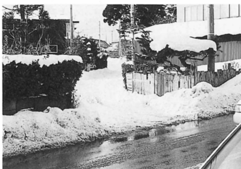
▲道路拡幅要望個所

条件を整えば計画できますが、財政の面もありますので実施は年次計画になると思います。