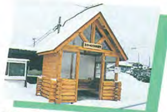
郷沢と瀬辺地に建てられたログハウス風のスクールバス停