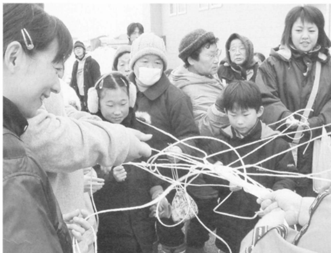
「どっぶ引き」何が当たるかなー

また、玉松海岸では集まった人たちが白鳥にえさをやったり、記念撮影をしたりしていました。