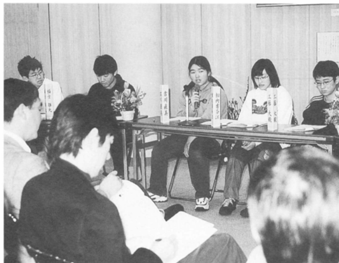
お父さん、お母さんには耳の痛い意見も…

「大事にしよう!!子どもの気持ち。聞いてみよう!!大人の考え」と題し、村内の中高生10名と大人の意見交換が行われました。日ごろ、家族や地域に対して感じている好きなどころ、いやなところなど子どもたちの率直な意見に、集まったお父さんお母さんが苦笑い…という場面も。親の立場からの考えや子どもたちへの思いも話され、お互いの気持ちを確認できた有意義な時間でした。