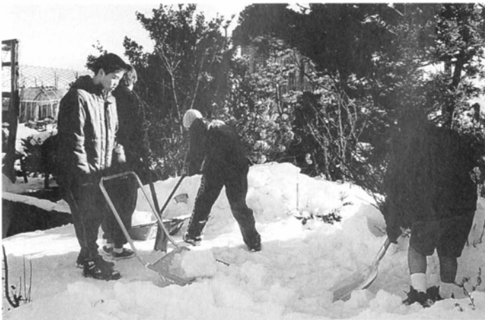
一生懸命だから寒くないんでしょうか？ 素足です↑