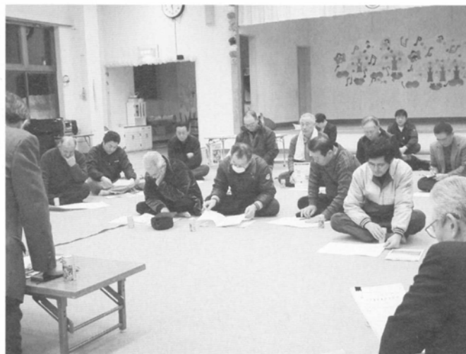
担当者の話に聞き入る住民たち

初日の蓬田保育所には、中沢、長科地区から住民14人が集まりました。関係者の説明を聞き、疑問な点への質問や、これからの村の農業に対する取り組みについて、意見が出されました。生活に関わる切実な問題だけに真剣なやりとりが交わされました。