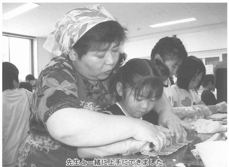
先生と一緒に上手にできました