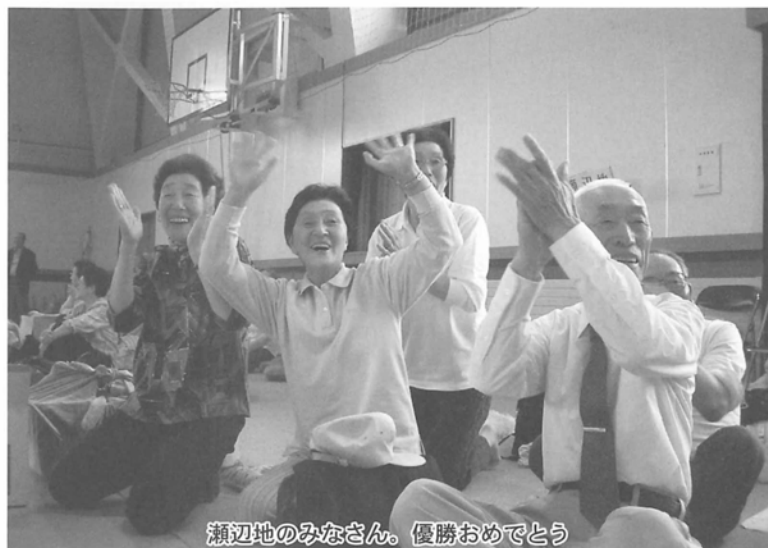
瀬辺地のみなさん。優勝おめでとう