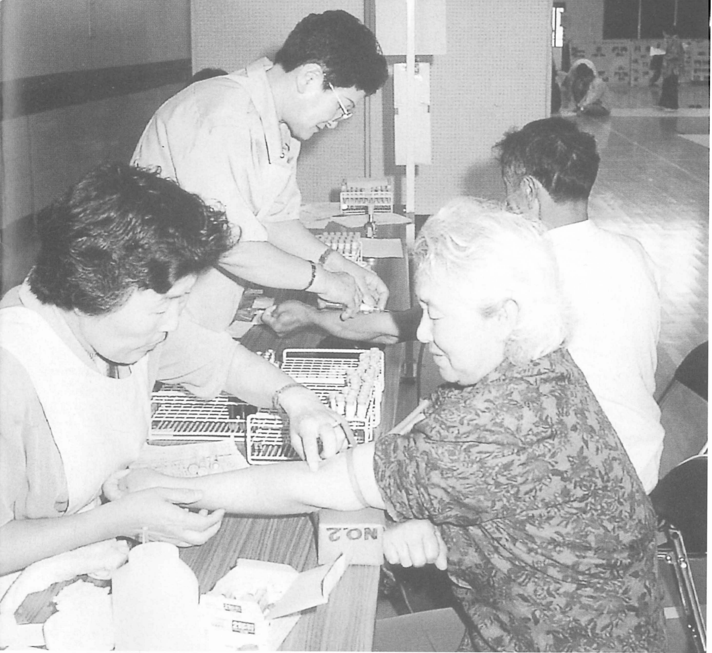
平成12年度の住民健診の様子。