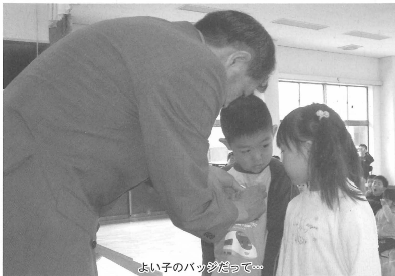
よい子のバッジだって…