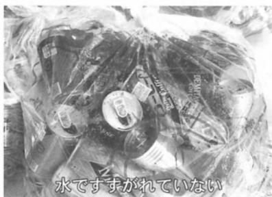
水ですすがれていない