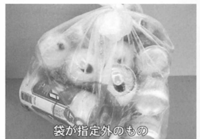
袋が指定外のもの