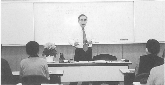
生活習慣病予防教室で病気について覚えよう

高血圧は動脈硬化を引き起こし、動脈硬化は更に高血圧をひどくします。その結果、脳卒中や脳動脈硬化症(痴呆症等)、心臓病(狭心症・心筋梗塞・心不全)、腎臓病(腎不全・尿毒症)等に悪影響を与えることとなります。そのため、普段から基本健診を受け自分の血圧がどの位あるのかを知り、血圧をうまくコントロールしていく必要があります。 今後も、循環器疾患を早期に発見するために基本健診や健康教育事業を継続し、生活改善に取り組む人が増えるよう普及していきます。