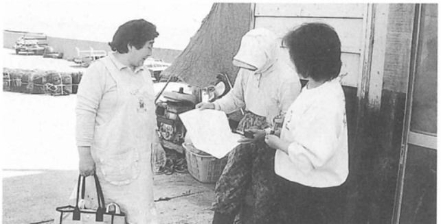
基本健診受診をすすめる保健協力員