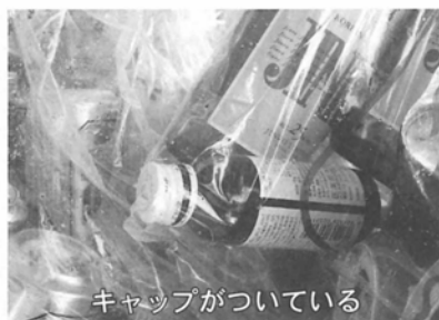
キャップがついている